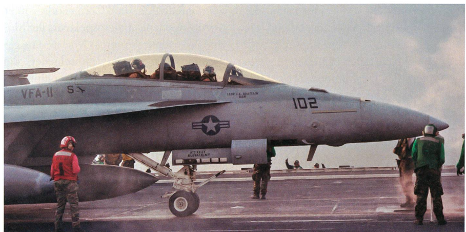
Eine F/A-18 F «Super Hornet» der Fighter-Attack Squadron VFA-11 wird von einem Katapult der Harry S. Truman gestartet.

derlich erachtete, ersucht nun wieder um eine militärische Permanenz, die unter anderem durch vermehrte amerikanische P-8A «Poseidon» Ubootaufklärungsflüge ab dem Luftstützpunkt von Keflavik sichergestellt wird, während NATO-Staaten wie jüngst sechs italienische F-35A Kampfflugzeuge wiederum den Luftraum über und ausserhalb von Island sichern. P-8A «Poseidon» der Royal Air Force werden in Kürze zusätzlich die Ubootüberwachung ab dem Stützpunkt von Lossiemouth in Schottland aufnehmen. Damit stehen NATO-Luftstreitkräfte nicht nur in Ablösungen im Baltikum im Einsatz, sondern neuerdings wieder verstärkt über dem Nordatlantik. Die im Kalten Krieg bekannt gewordene «G-I-UK Gap» (Grönland-Island-Grossbritannien Lücke), welche u.a.