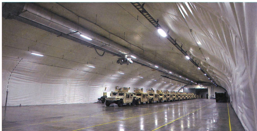
Das US Marine Corps lagert seit vielen Jahren Rüstungsmaterial in Kavernen in Norwegen. In Krisenlagen werden die Marineinfanteristen eingeflogen und übernehmen ihre Ausrüstung.

Das sicherheitspolitische Gewissen in Nordeuropa ist zurück. Zahlreiche Staaten dieser Region haben erkannt, dass die Lage in Wirklichkeit nicht so stabil ist, wie sie über lange Zeit perzipiert wurde. Niemand beschwört eine Neuauflage des Kalten Krieges herauf, aber dieses Mal sind die NATO wie andere, unabhängige Staaten der Region bemüht, ein dezidiertes Zeichen ihrer Entschlossenheit zu setzen. Dies ist umso wichtiger, als sie fast alle die in den vergangenen Jahren anfallenden Friedensdividenden bei weitem nicht kompensiert haben. +