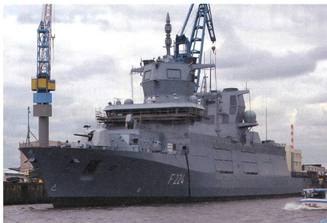
Die deutsche Marine führt gegenwärtig die hochmodernen Fregatten der neuen Klasse 125 ein, für die Führung von Operationen fernab der Heimat.