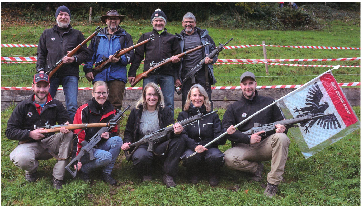
In der Regel auf dem Rütli vorn: Die Schützen der SG Aarau, Mannschaftssieger 2019.