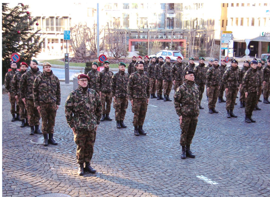
Ein neuer Lehrgang beginnt.