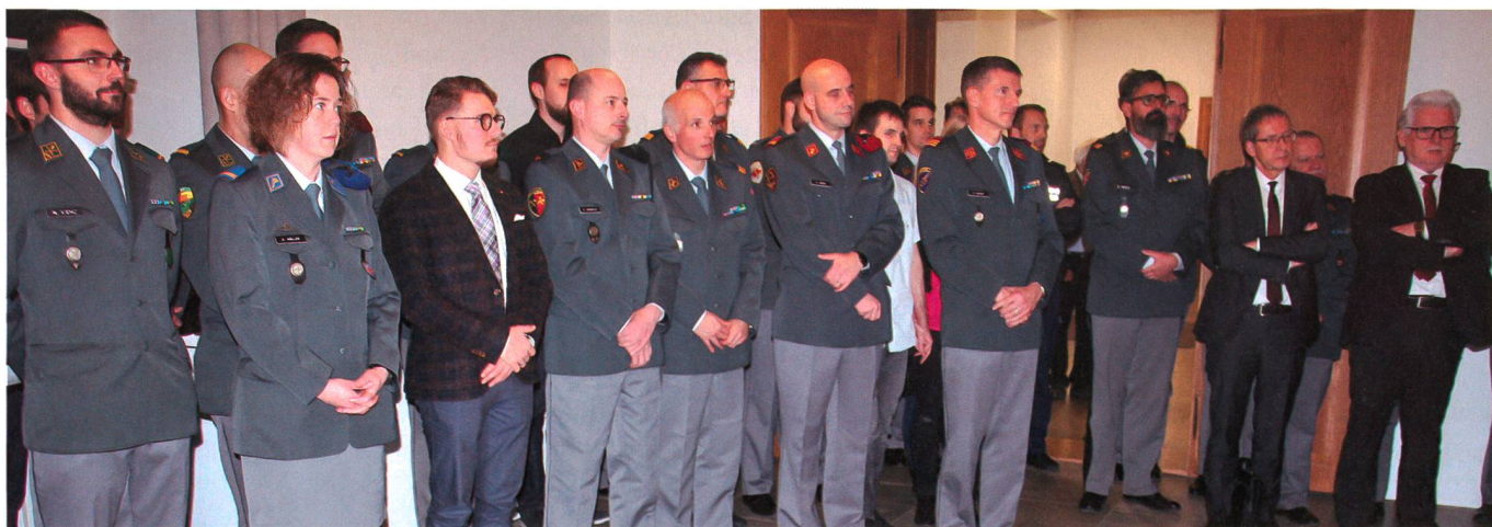
Besuch im Foyer der Gedenkausstellung René Villiger.

Hunderte von Tagen aber, an denen alle mit Pflichtbewusstsein, Loyalität und Souveränität dem Land gedient hätten. «Das ist besonders wichtig oder sogar unentbehrlich für eine funktionierende Armee». Er streifte auch geschichtliches aus der Schweizer Armee sowie die Veränderungen in der ganzen Welt. Die Bedrohungslage und die Herausforderungen der Gegenwart hätten sich sehr verändert. Aufgabe, auch der obersten Kader der Armee sei es, gegenüber der Bevölkerung die Sicherheitslage und die konkrete Bedrohung offen zu kommunizieren, ohne zu dramatisieren, aber auch ohne zu bagatelisieren. Die Armee müsse in der Schweiz von breiten Schichten der Bevölkerung getragen werden und die Notwendigkeit der Landesverteidigung mit überzeugenden Argumenten aufgezeigt werden. «Wir entlassen sie heute aus den Pflichten als Offiziere oder höhere Unteroffiziere», aber es heisse: «Einmal Offizier – immer Offizier» und auch «Einmal Unteroffizier – immer Unteroffizier». Auch in der Gesellschaft, in der Politik, in Fachgremien und Vereinen sei das Engagement dringend notwen-