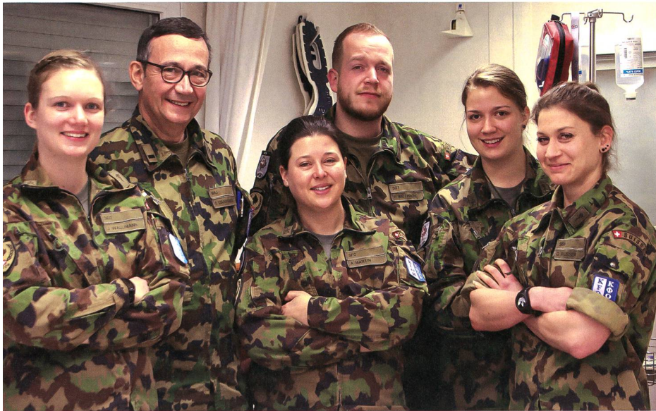
Das Schweizer Medic Team.

terre des Medic Centers. Hier empfangen sie die Patienten oder leisten dem Schweizer Arzt Unterstützung. «Wir legen Infusionen oder assistieren bei der Wundversorgung,» erklärt Schurtenberger. «Auch bei Notfällen werden wir alarmiert, beispielsweise wenn ein Soldat mit dem Fahrzeug verunfallt.»