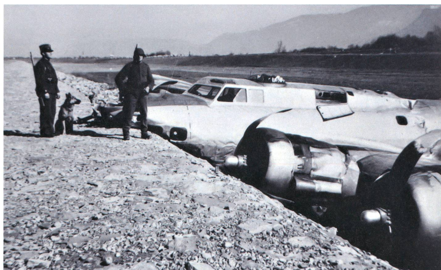
Durch den Damm gestoppt.