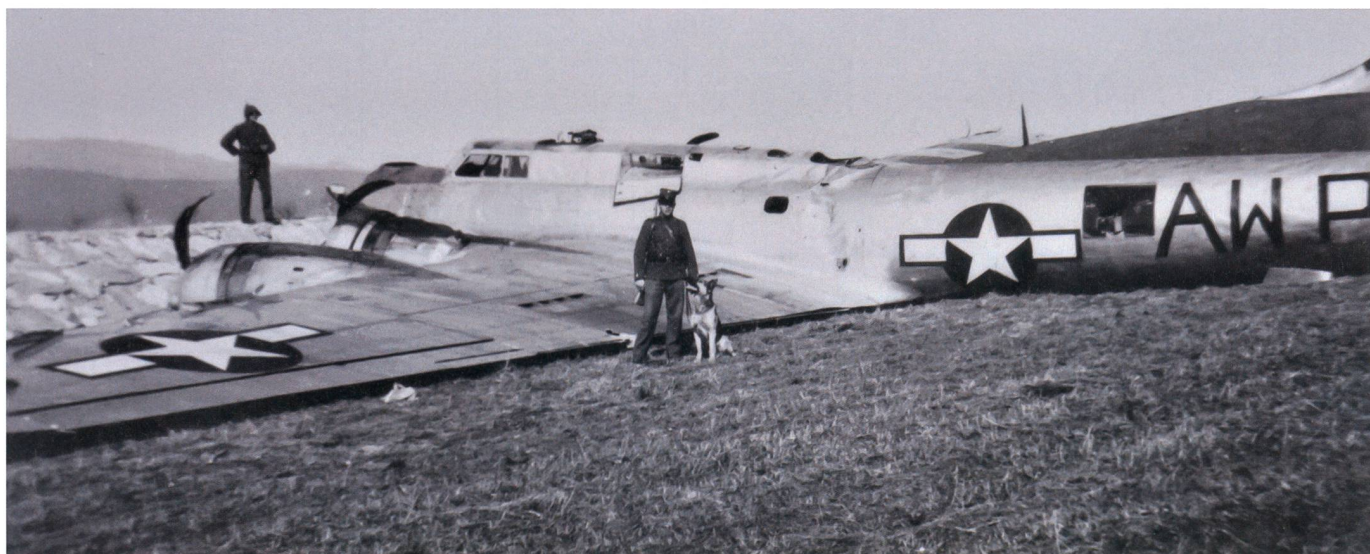
Notlandung geglückt: Das Flugzeug erreichte die Schweiz.

Der Bomber flog von Osten in die Schweiz ein. Augenzeuge Linus Wüst, 1934, Mont-