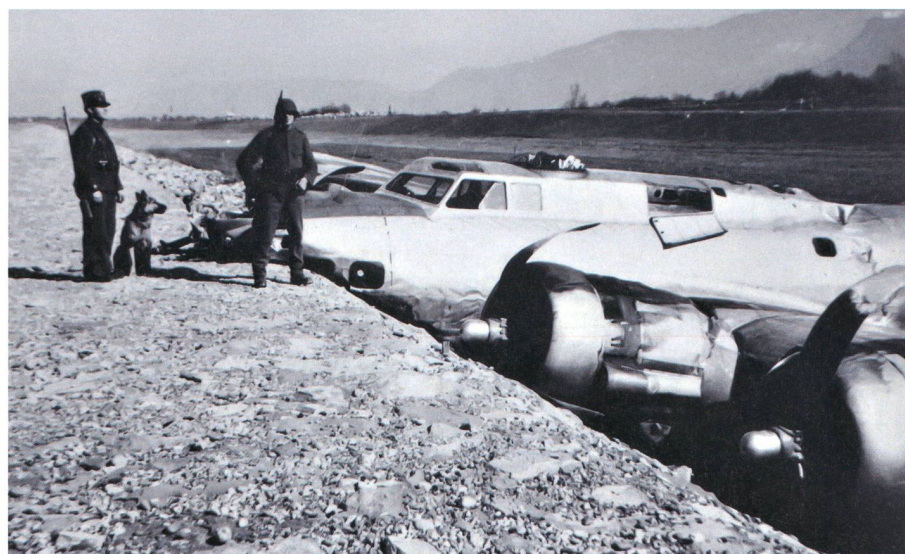
Durch den Damm gestoppt.