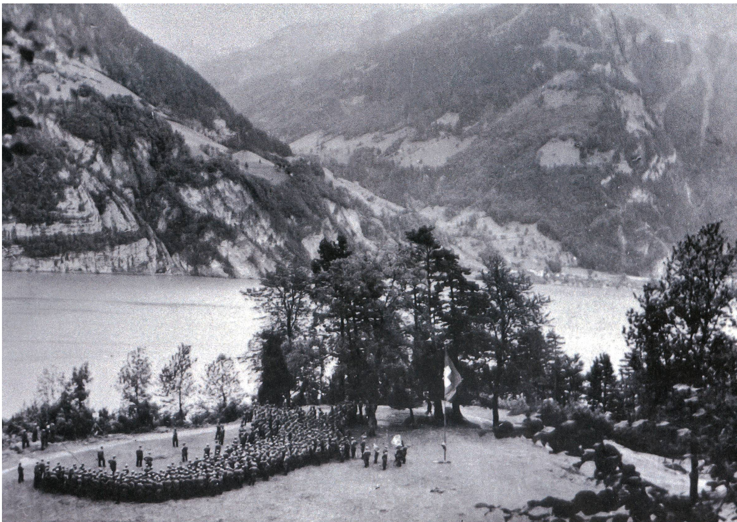
Kommandanten bis auf Stufe Bataillon auf der Rütli-Wiese.