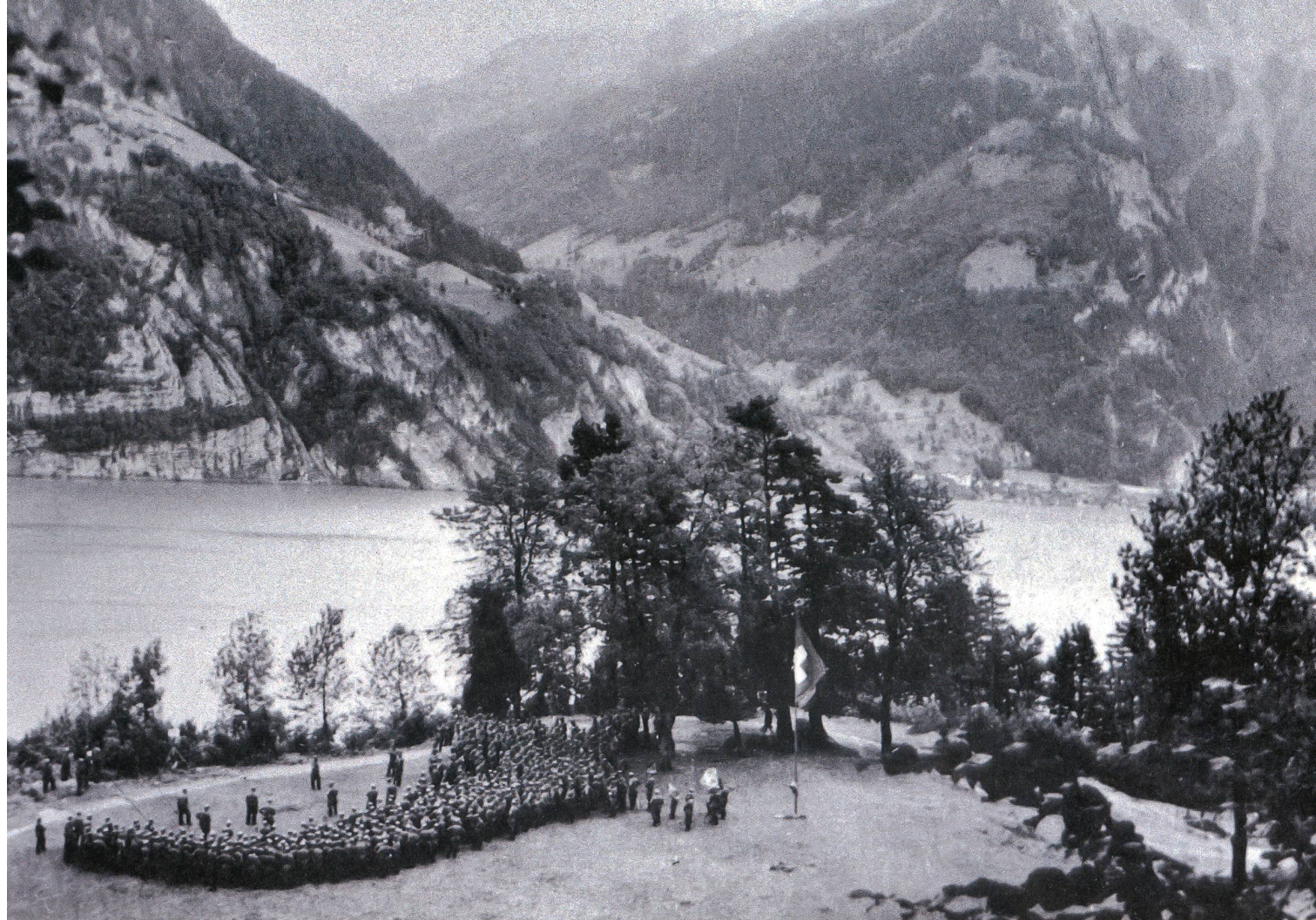
Kommandanten bis auf Stufe Bataillon auf der Rütli-Wiese.