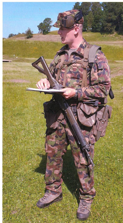
Feldtag beim Besprechen einer Lektion.