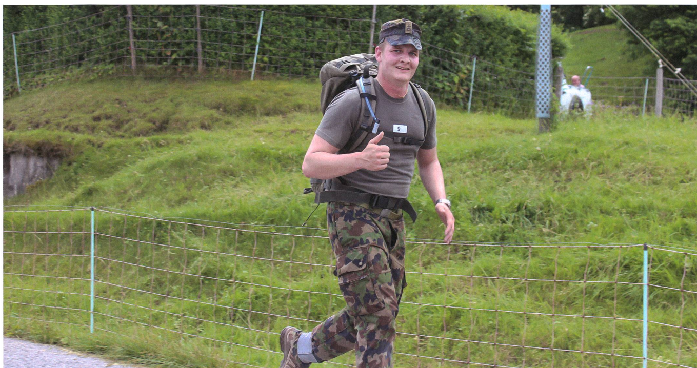
Hptfw Schaller beim 15-km-Waffenlauf – nach zwei Dritteln der Strecke.

send für die praktische Fahrprüfung zugelassen zu werden. Also begann für mich ab dem zweiten Tag der Unterricht: Von 0730 Uhr bis 1200 Uhr mit der theoretischen Ausbildung, wie Ladungssicherung, Gewichte und Masse der Fahrzeuge, Ruhezeiten und so weiter. Dies war für den Kopf ziemlich anstrengend. Nach einer kurzen Erholungspause ging es am Nachmittag mit vier LKW-Übungsfahrstunden weiter, bevor wir in den Feierabend entlassen wurden, der verständlicherweise von Selbststudium geprägt war. Dieser Tagesablauf veränderte sich während der zwei Ausbildungswochen nicht sonderlich stark. Ich selbst bemerkte beim Fahren von Tag zu Tag Fortschritte, wodurch ich auch in der Theorie rasch an Sicherheit gewann. Nach zwei intensiven Wochen durften meine Kameraden und ich in der dritten Woche zur Prüfung antreten: Wir haben alle bestanden!