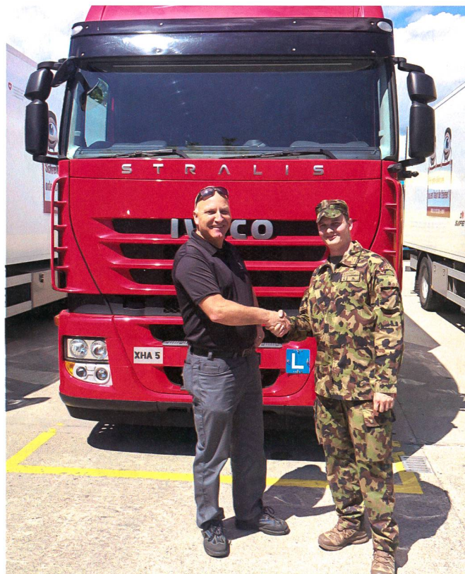
Der Fahrlehrer gratuliert zur Kat C Prüfung.