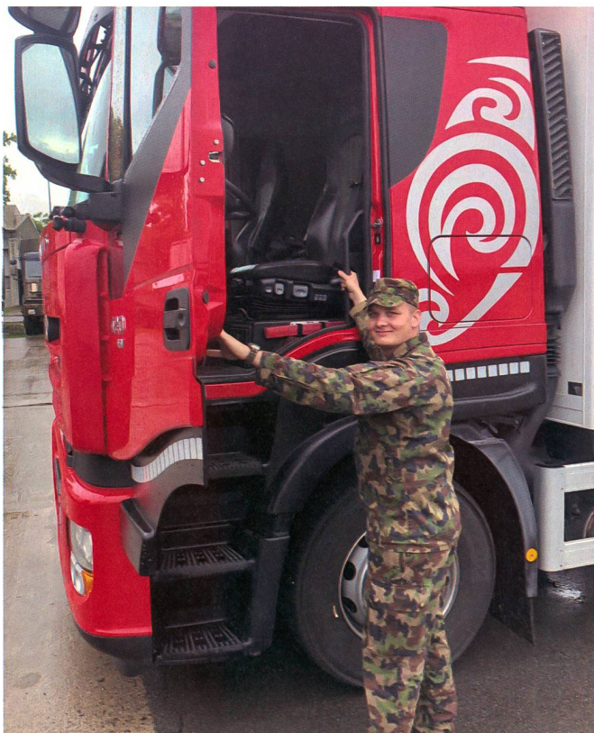
Erste Fahrstunde mit dem LKW.

Die erste Voraussetzung war das Bestehen der theoretischen Prüfung, um anschlies-