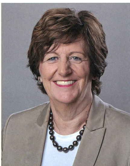
Ida Glanzmann-Hunkeler, Präsidentin SIK NR.

len; Gmür-Schönenberger Andrea, LU, CVP; Häberli-Koller Brigitte, TG, CVP; Jositsch Daniel, ZH, SP, militärischer Grad: Oberstleutnant; Juillard Charles, JU, CVP, militärischer Grad: Oberst; Kuprecht Alex, SZ, SVP, militärischer Grad: Korporal; Salzmann, Werner, BE, SVP, militärischer Grad: Oberst; Vara Céline, NE, Grüne Partei; Wicki Hans, NW, FDP-die Liberalen, militärischer Grad: Hauptmann; Zopfi Matthias, GL, Grüne Partei; militärischer Grad: Soldat. +