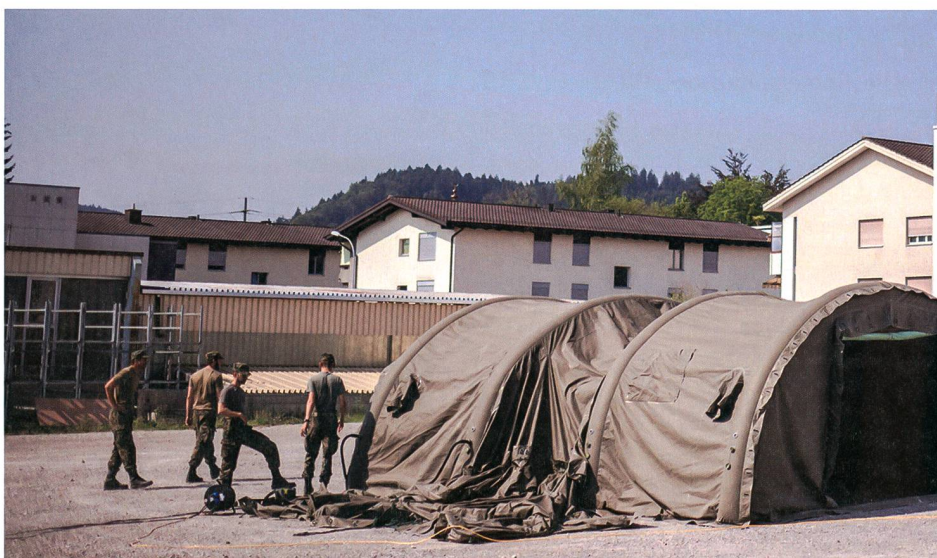
Der Komm Panzer der Führungsstaffel ist in Verbindung mit dem RAP Panzer.