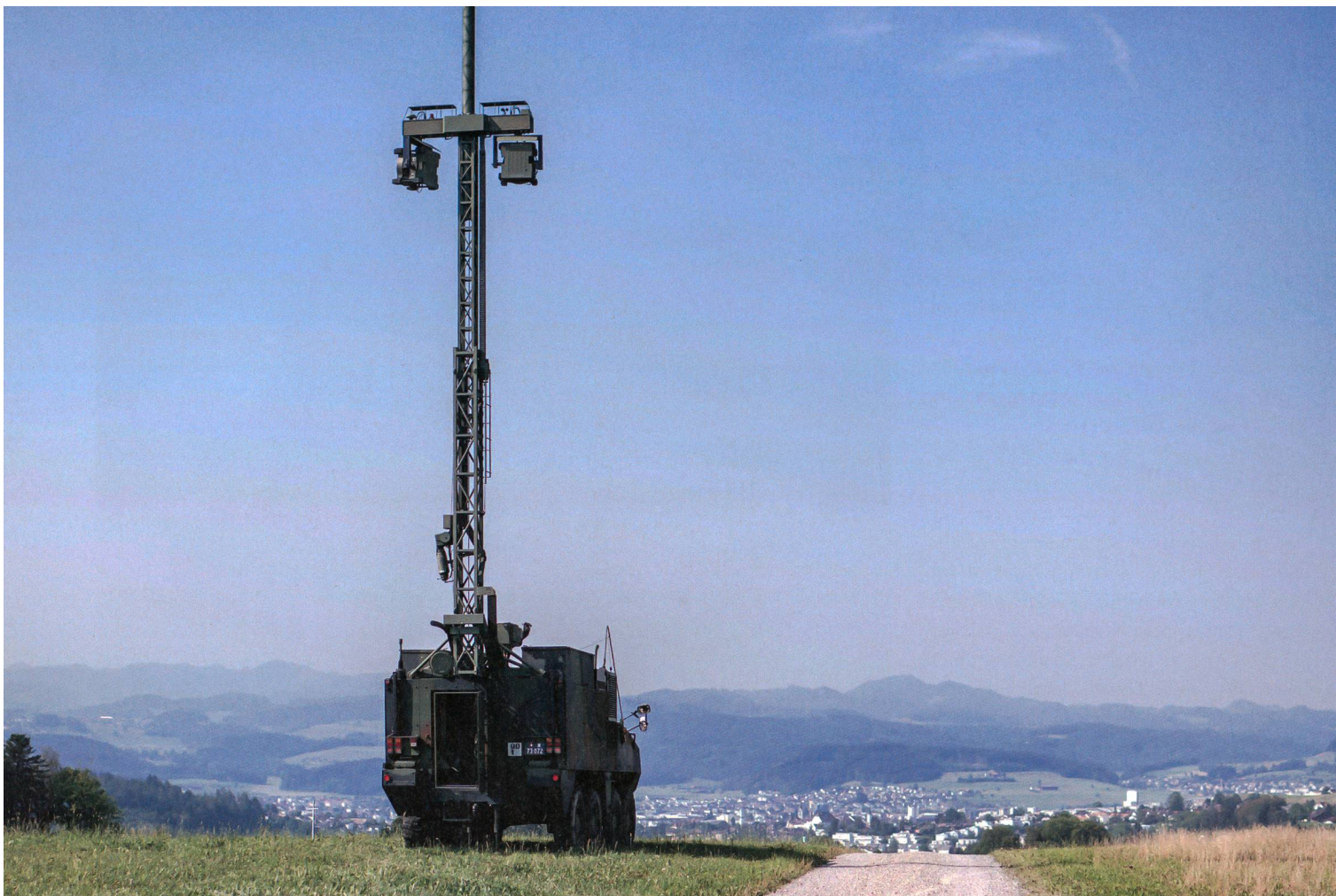
Der RAP Panzer ist ein zentrales Element für die Sicherstellung der Verbindungen zwischen den einzelnen Beteiligten der Übung.