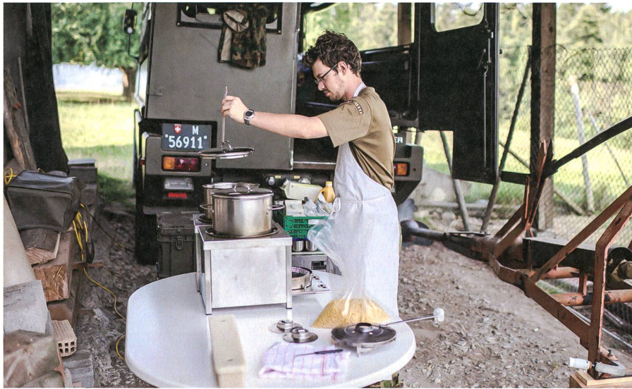
Verpflegung am Aussenstandort.