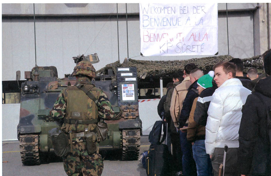
Der Weg in die militärische Gemeinschaft.