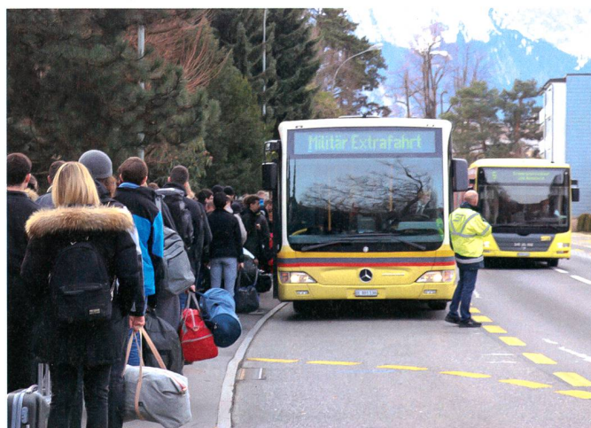
Per Extrafahrt zum Waffenplatz Thun.

Was geschieht denn hier? Eine Gruppe asiatische Touristen beobachtet neugierig, wie sich dutzende junge Männer und einige Frauen am Bahnhof Thun versammeln. Selbst der Tourguide scheint sprachlos zu sein, als Soldaten die jungen Schweizer in einer grossen Kolonne sammeln. Die Touristen aus Fernost wurden gerade Zeuge eine der wohl wichtigsten Schweizer Pflichten und Traditionen: Junge Bürgerinnen und Bürger verlassen ihr Zuhause um sich für die Sicherheit unseres Landes einzusetzen.