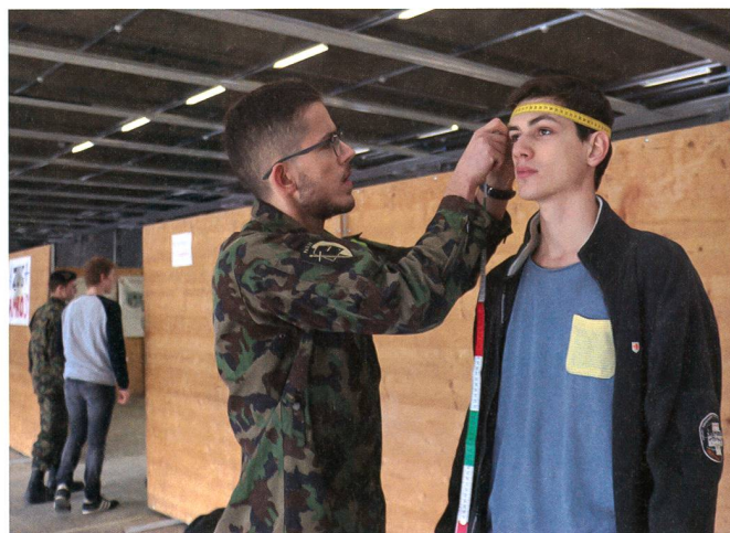
Präzision bei der Abgabe der Ausrüstung.

Der Shuttlebus setzt sich in Bewegung in Richtung Doufourkaserne. Im Fahrzeug begegnen wir den unterschiedlichsten jungen Menschen. Einige tragen schicke Markenkleidung, andere Pullover ihrer Mannschaft. «Nun müssen wir wohl Deutsch lernen», hört man einen Westschweizer zu seinem Kameraden sagen. Die jungen Bürger kommen aus allen