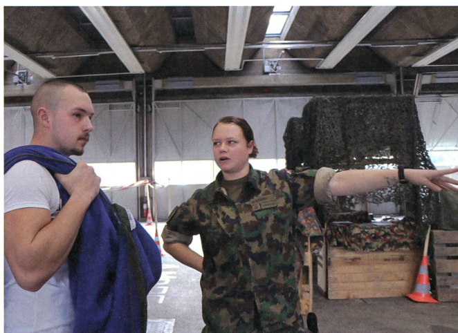
Das Material ist gefasst – Nun geht es zum neuen Zug.