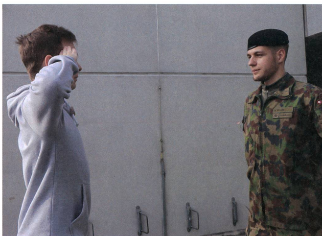
Eine der ersten Lektionen: Militärische Umgangsformen.