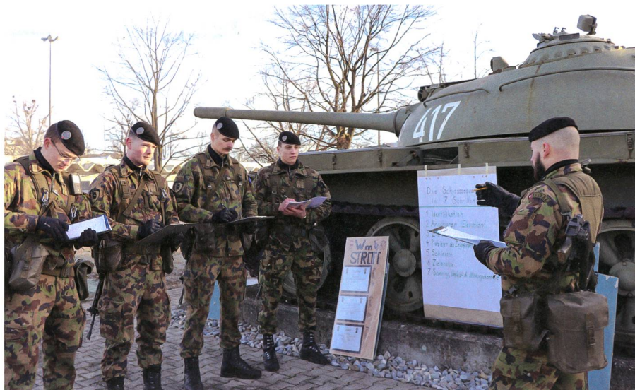
Zugführer gibt am Ausbildungsrapport Feedback an seine Gruppenführer.

Praktischen Dienst sind 19 und 20 Jahre alt. Hoffmann absolvierte das Gymnasium während Ueltschi eine Lehre als Polymechaniker abschloss. Als wir die Unteroffiziere zum Gespräch trafen, waren sie noch in den Vorbereitungen für den Start der