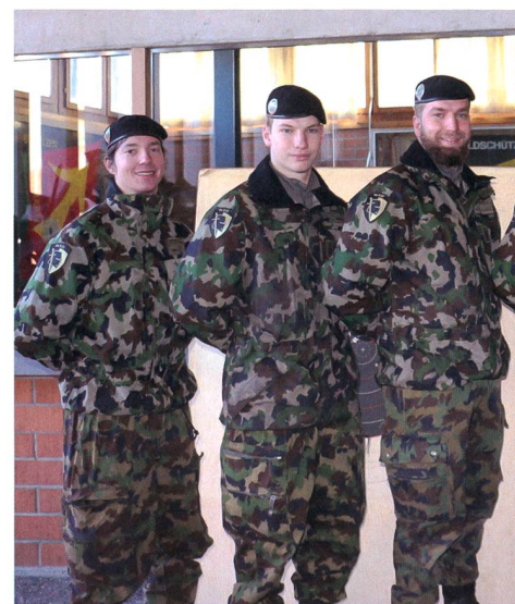
Der Zug BIVIO (Pz Kp 21/2) ist bereit.