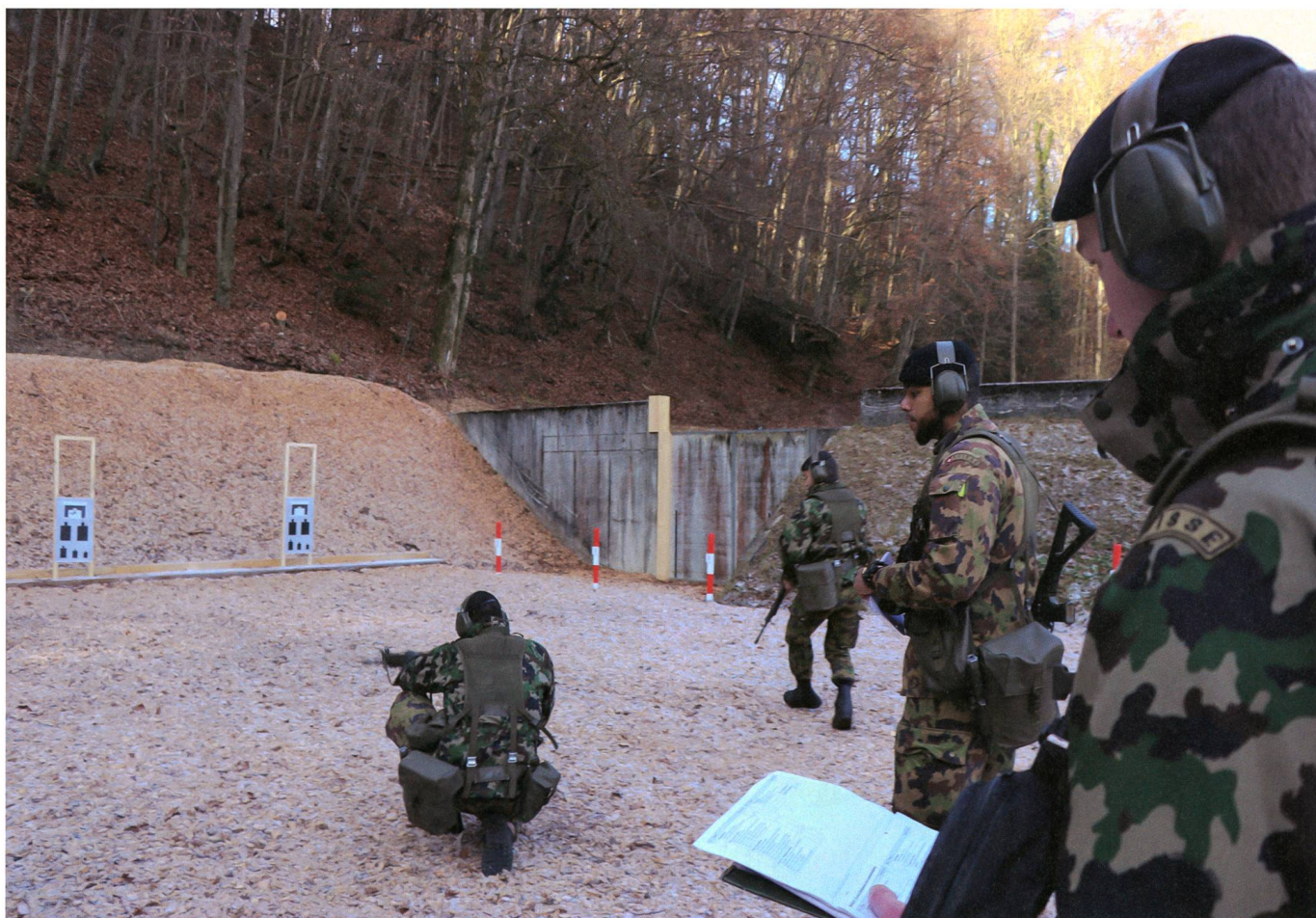
Praktische Schiessausbildung der Gruppenführer – überwacht durch den Zugführer.