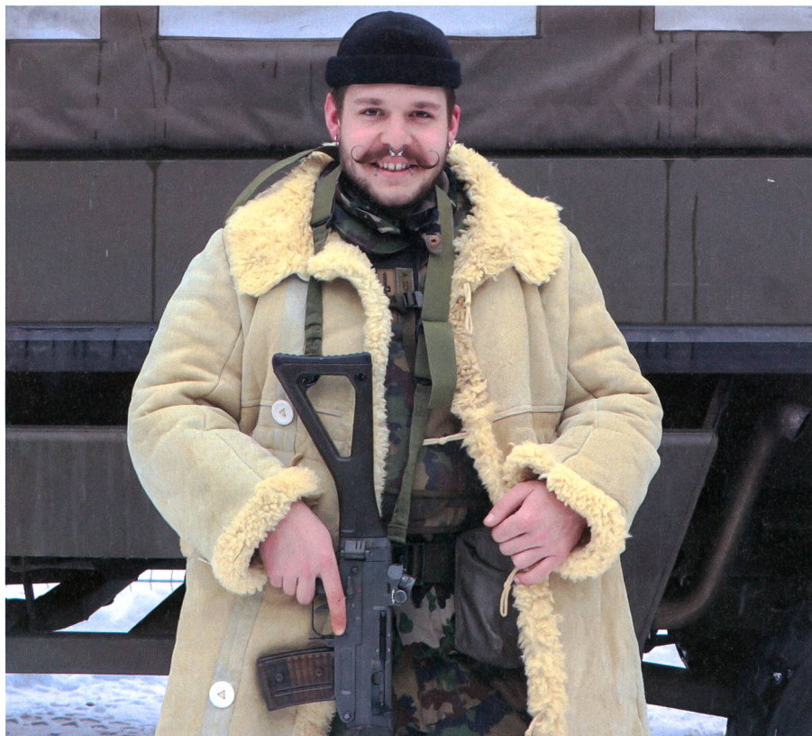
Fellmantel: heute noch zweckmässig.

Logistik, Ausbildung und die richtige Führung: Vieles ist wichtig, damit ein Einsatz wie dieser gelingt. Dabei muss sorgsam und vorausdenkend vorgegangen werden. Ein Beispiel zum Thema Sorgfalt: Ausbildungskontrolle als Heft. Vom Soldaten bis zum Stabsoffizier trägt jeder ein Kontrollheftchen, in dem die absolvierten Repetitionen geführt werden. So kann jeder Verantwortliche auf Platz innert kurzer Zeit überprüfen, ob die eingesetzten Soldaten die befohlene Aufgabe übernehmen können. Beobachtungsposten verlangen zum Beispiel, dass der AdA in der Nachrichtenbeschaffung geschult wurde. Doch abgesehen von der Ausbildung und dem Einsatz muss auch der Dienstbetrieb und die Logistik reibungslos funktionieren: «Ne-