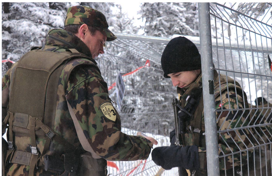
Jeder Zutritt wird gründlich kontrolliert.

ben unseren Aufträgen sind wir auch für die Instandhaltung und Logistik von vielen Bodentruppen des WEFs verantwortlich», so Oberstlt i Gst Disch. Das Geb Inf Bat 29 leistet somit eine vielseitige Leistung für das Gesamtsystem.