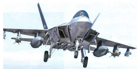
MBDA Meteor für den KF-X.

MBDA hat von Korea Aerospace Industries einen Auftrag für die Integration der Meteor Luft-Luft-Lenkwanne in das zukünftige Kampfflugzeug KF-X erhalten. Der Vertrag beinhaltet die Integrationsunterstützung für KAI, Know-how-Transfer und die Herstellung von Testgeräten für die Integrations- und Testkampagne des KF-X. «Südkorea ist ein strategischer Markt für MBDA, und wir sind stolz dar-