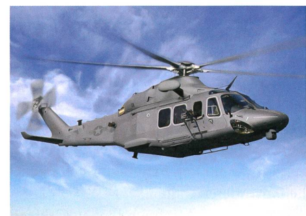
Boeing MH-139A Grey Wolf.