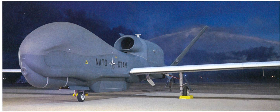
NATO-Drohne RQ-4D in Italien angekommen.

Das zweite unbemannte Gefechtsfeldüberwachungsflugzeug RQ-4D des NATO-Bündnisses ist in Europa eingetroffen. Diese jüngste Atlantiküberquerung von Kalifornien nach Italien wurde vollständig von einem Piloten auf der AGS-Hauptbasis in Sigonella kontrolliert. Die Northrop Grumman RQ-4D, auch bekannt als «Phoenix», startete am Mittwoch, 18. Dezember 2019 um 8:40 Uhr Ortszeit von der Edwards Air Force Base in Kalifornien, USA und landete etwa 20 Stunden später auf der AGS Main Operating Base auf Sizilien.