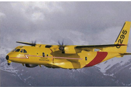
CC-295 für die kanadischen Such- und Rettungskräfte.

Die Royal Canadian Air Force hat in Sevilla ihre erste Airbus C295 in Empfang genommen. Bis 2022 sollen 16 Maschinen ausgeliefert sein, die die Bezeichnung CC-295 erhalten. Ab dann läuft auch der Wartungs- und Supportvertrags für das Flugzeug mit Airbus, der mit Optionen bis 2042 laufen kann. Das neue Such- und Rettungsflugzeug übernimmt die Aufgaben von sechs CC-115 Buffalo und zwölf