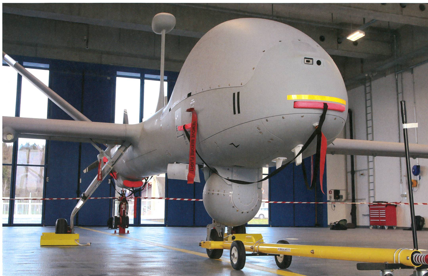
Frontansicht: «Hermes 900 HFE».