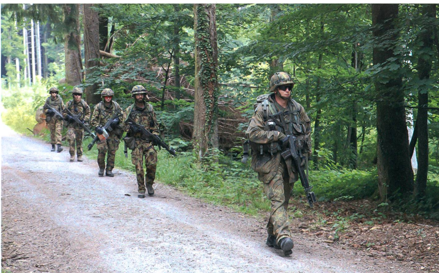
Auf der Verschiebung bei der Übung «DURO».

An der BUSA angekommen, traf mich dann gleich der Schlag. Ich war es bereits gewohnt, mit Abkürzungen und Zahlen zu arbeiten. Jedoch habe ich gemerkt, dass das Militär viel zu viel davon benutzt. Allein die Reglemente und einfachsten Dinge hatten andere Namen, wie z.B. der Rucksack (Packung). Nach einer kurzen Eingewöhnung war aber auch das nur noch selten ein Problem. Viel mehr hatte ich Mühe mit den Theorieeinheiten, die in der Anfangszeit eine hohe Frequenz hatten, zurechtzukommen. Die Schulbank