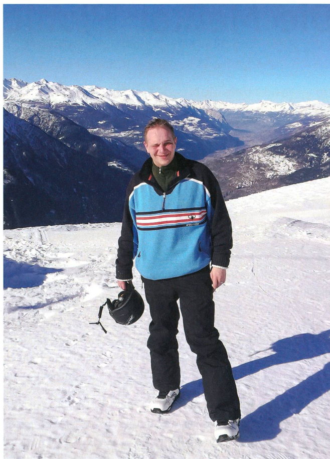
Ein Tag beim Snowboarden im wunderschönen Wallis auf dem Rossberg.

drücken musste erst wieder gelernt werden. Die BUSA machte es uns dahingehend so komfortabel wie möglich. Die Ausbildung wie auch die Ausbildungsthemen waren sehr gut organisiert und auch unsere Lehrer waren methodisch hervorragend geschult.