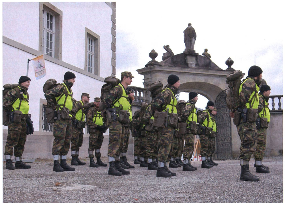
Genie, Rettung und ABC vereint.