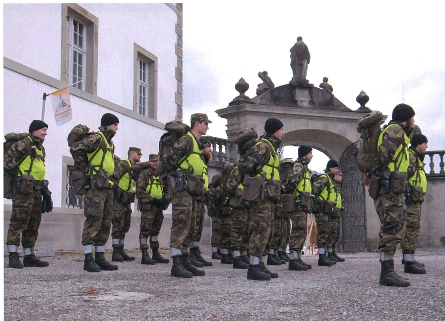
Genie, Rettung und ABC vereint.