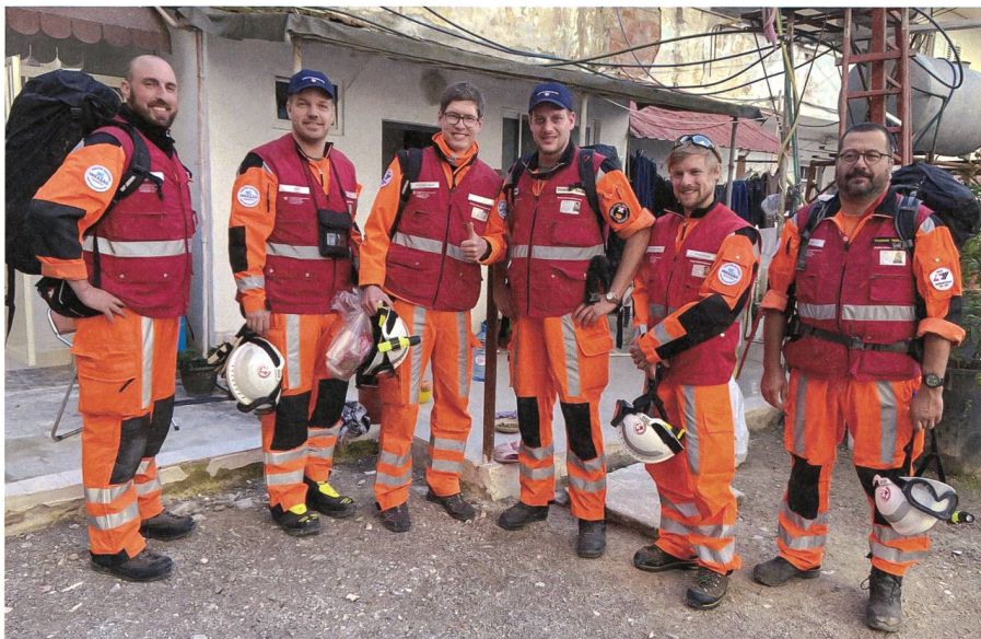
Das Schweizer Sofort-Einsatzteam.

Teams. Sie waren also in der ersten Phase «Urban Search and Rescue» unser Ansprechpartner. Anschliessend hat die EU mit ihrem «European Civil Protection Mechanism» die Leitung übernommen und die ganzen «Damage Assessments» vor Ort koordiniert. Dabei konnten wir eine wichtige Rolle als verlängerter Arm der EU (welche vor allem in der Hafenstadt Durrës war) wahrnehmen, da wir die Koordination für die EU im ländlichen Gebiet übernommen haben.