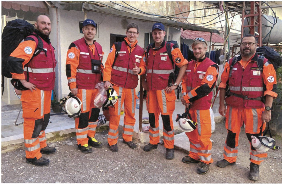
Das Schweizer Sofort-Einsatzteam.

Teams. Sie waren also in der ersten Phase «Urban Search and Rescue» unser Ansprechpartner. Anschliessend hat die EU mit ihrem «European Civil Protection Mechanism» die Leitung übernommen und die ganzen «Damage Assessments» vor Ort koordiniert. Dabei konnten wir eine wichtige Rolle als verlängerter Arm der EU (welche vor allem in der Hafenstadt Durres war) wahrnehmen, da wir die Koordination für die EU im ländlichen Gebiet übernommen haben.