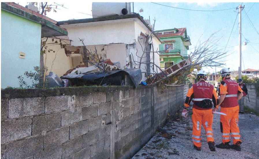
Unübersichtlich – Das Beben hat grosse Schäden angerichtet.

Scholl: Die Unterstützung der Familie und Arbeitgeber sind ein sehr wichtiger Bestandteil. Innert kürzester Zeit habe ich im Geschäft und zu Hause alles liegengelassen und bin eingerückt. Meine Partnerin, die Familie und sowie mein Arbeitgeber wissen, dass ich mit Herzblut im SKH tätig bin und unterstützen mich voll und ganz dabei.