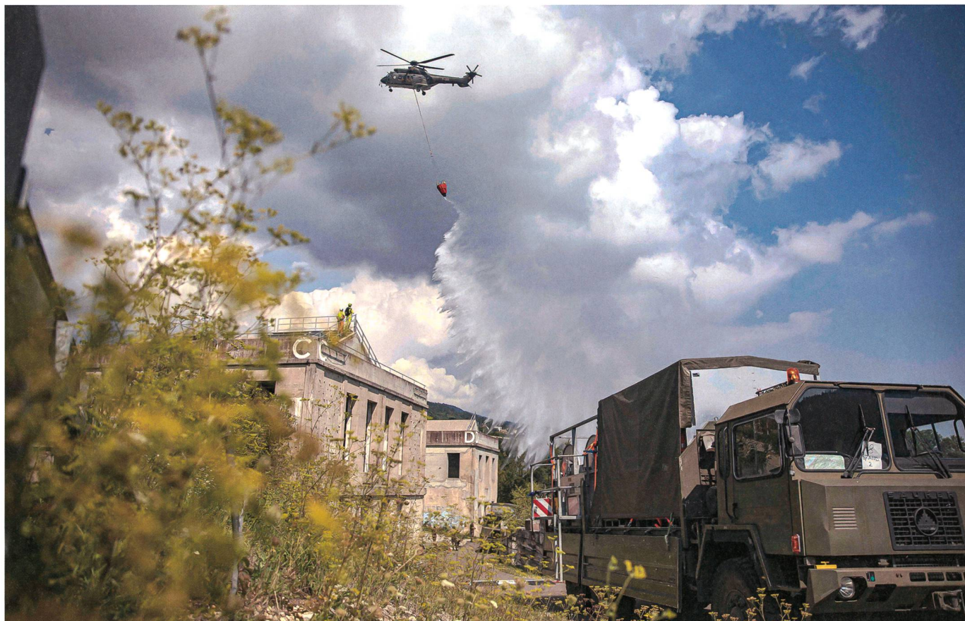
Einsatz in Epeisses.

Obwohl in zwei Gebiete geteilt, konnte das Rettungsbataillon 3 die eigenen Aufträge wirksam ausführen. Einzig der Verkehr auf den Strassen brachte es fertig, die motivierten Armeeangehörigen im Einsatz