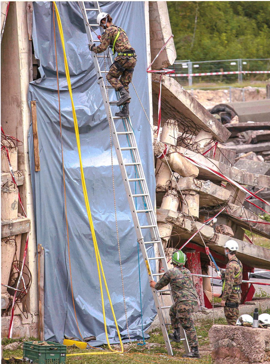
Mit Teamwork zum Erfolg.

zu verlangsamen. Angesichts der zufriedenstellenden Performance, entschied sich die Übungsleitung, die Latte höher zu stellen, indem Sie das Rettungsbat 3 zu zwei zusätzlichen Einsätzen aufforderte. Der erste Einsatz simulierte eine Mission auf der Suche nach den Black Boxes zweier im schweizerischen Luftraum von einer terroristischen Gruppe abgeschossenen Linienflugzeuge. Eine Kompanie befand sich deshalb auf den bewaldeten Hügeln über Zug bei Sonnenuntergang in einer Situation mit prekären Lichtverhältnissen und mit der Ungewissheit bezüglich einer möglichen Präsenz der Gegenseite.