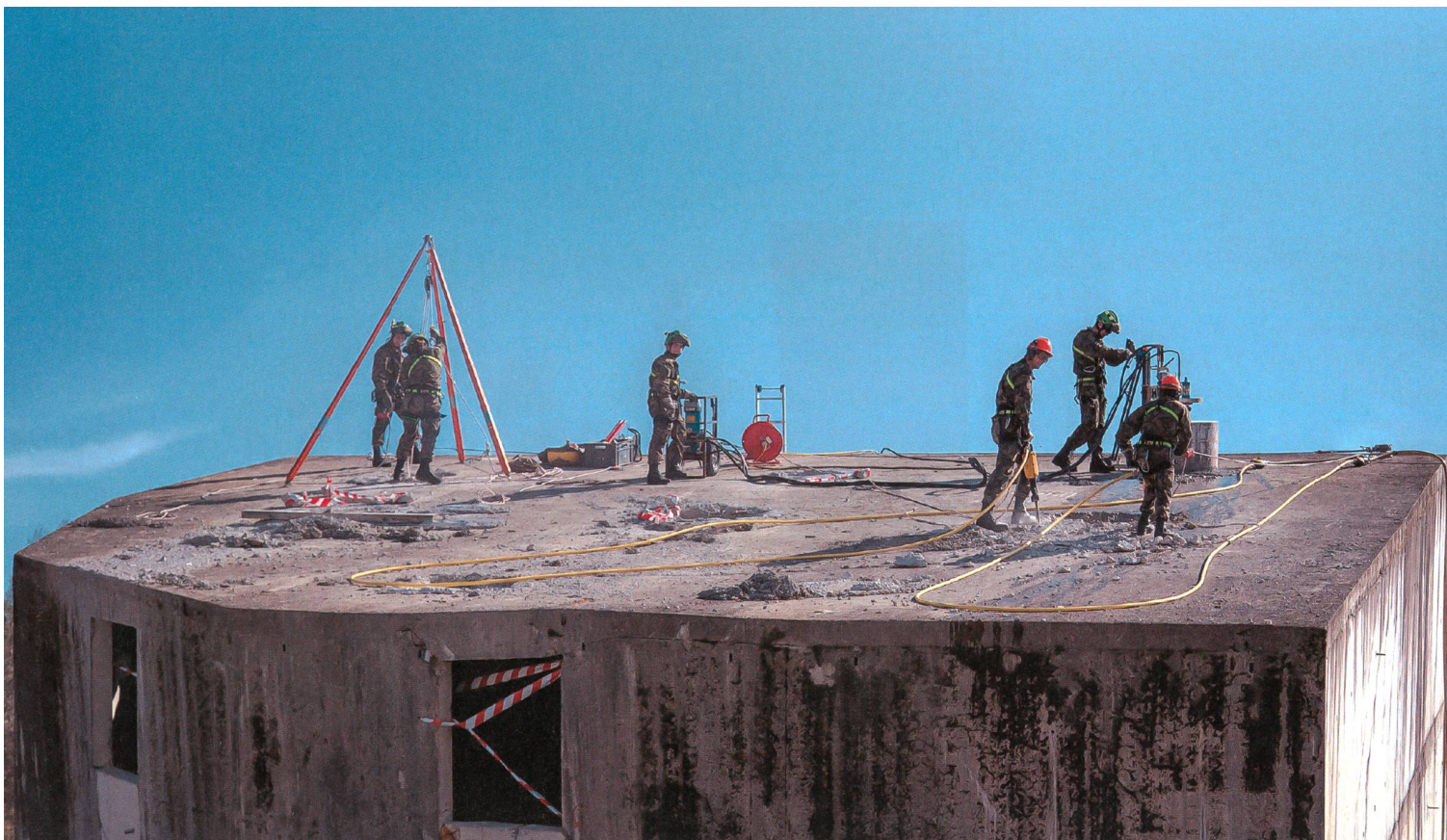
Auch in schwierigem Terrain einsatzfähig.