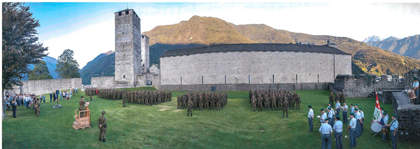
Zur Fahnenabgabe angetreten: Das Rettungsbataillon 3.

– ein Bereich, in welchem die Rettungskompanien eine ausgezeichnete Arbeit geleistet hatten. Ein Verbesserungspunkt für die Zukunft stellt das taktische Verhalten dar, womit Aspekte wie die Selbstverteidigung sowie die Sicherung und Verteidigung des Einsatzraumes gemeint sind.