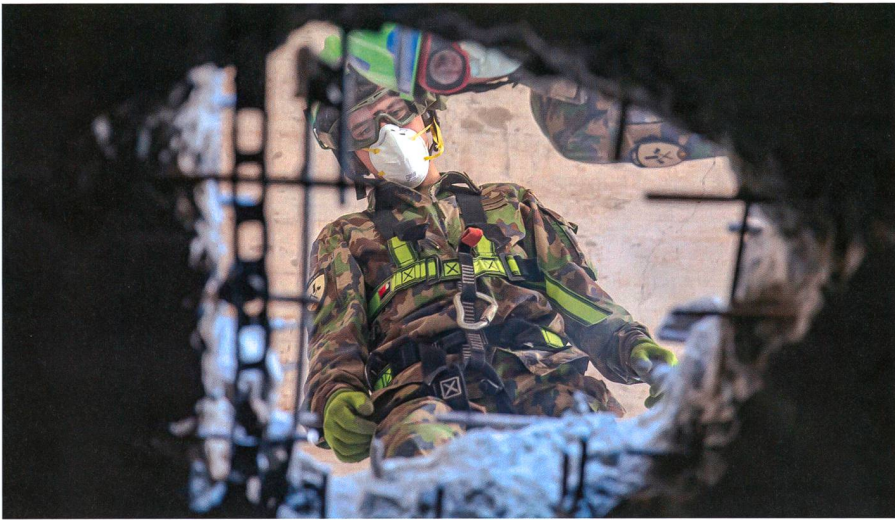
Auf der Suche nach Verschütteten.