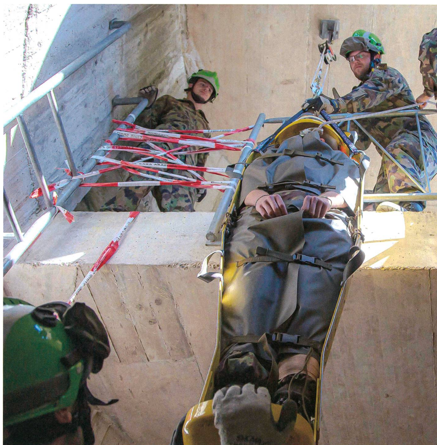
Bergung eines Verletzten aus Trümmernlage.