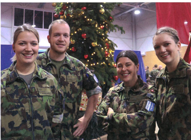
San Uofs der Swisscoy.