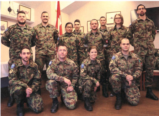
Angehörige der EUFOR Mission.