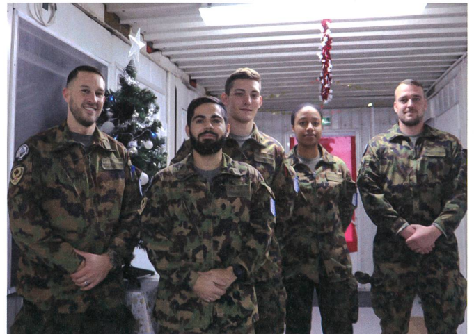
Auch über die Festtage im Einsatz: LMT- Team Nr 4.