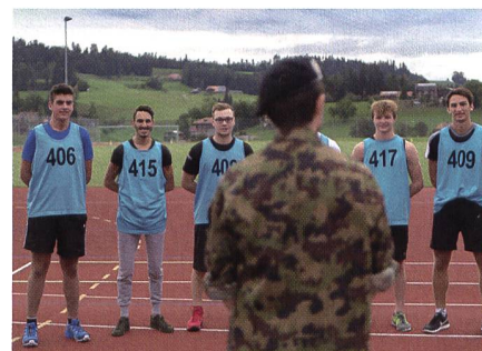
Sport in der Armee