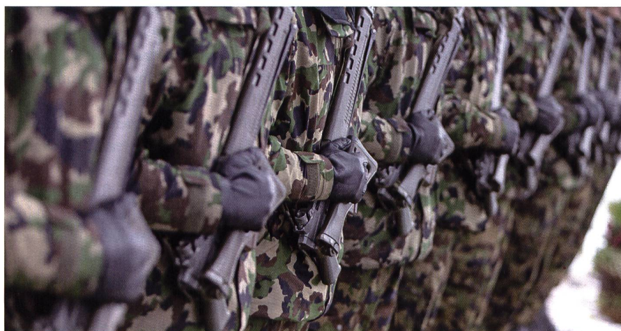
In Reih und Glied und trotzdem unterschiedlich: Diversity in der Armee.