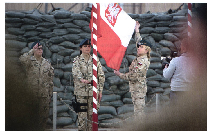
«Diene der Republik als Soldat».

Die NATO führt in unserer Region Übungen durch, die ihre Bereitschaft zur Verteidigung der Verbündeten an der Ostflanke deutlich zeigen. Man braucht gar nicht zu erwähnen, dass die Zahl der an diesen Übungen teilnehmenden Soldaten sowie ihr typisch defensiver Charakter auf keinerlei offensive Absichten schliessen lassen, sondern nur eine Bereitschaft zur kollektiven Verteidigung des eigenen Territoriums demonstrieren. Darüber hinaus wird laut einem bilateralen Vertrag mit den USA bald die Zahl der in Polen stationierten amerikanischen Soldaten steigen. Auch diese Massnahme zur Stärkung der