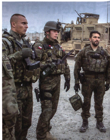
«Aktive Beteiligung an NATO-Einsätzen ist zweifellos eine Frage der Glaubwürdigkeit Polens als Bündnispartner.»

Ich weiss es zu schätzen, dass die Schweiz, trotz ihrer Neutralität, die Hauptgefahren für den Weltfrieden ähnlich wie Polen wahrnimmt, was z. B. aus