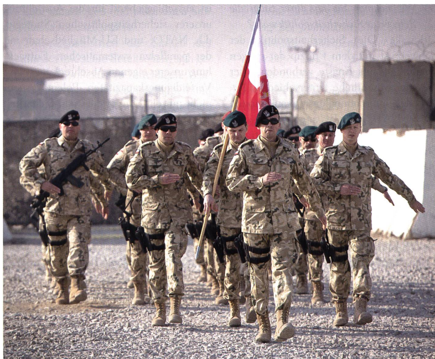
2014 wurde die Modernisierung der polnischen Streitkräfte beschlossen.

Ähnlich wie die viel früheren Schweizer Reisläufer kämpften und starben Polen auf allen Fronten des 1. und 2. Weltkriegs. Einige, so wie die Soldaten der polnischen 2. Schützendivision, haben ihren Kriegszug in der Schweiz beendet. Zu meinen Aufgaben gehört auch die Pflege der Erinnerung an die polnischen Soldaten und