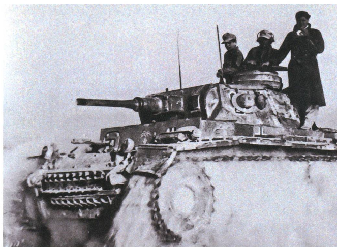
Deutscher Panzer III Ausf. H, 15. Panzer-Division, auf dem Vormarsch Richtung Bir Hacheim, Mai 1942.