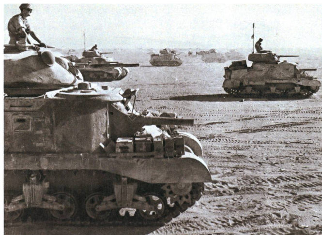
Panzer M3 Grant, 1. Panzer-Division, auf dem Vormarsch Richtung Bir Lefa, Juni 1942.