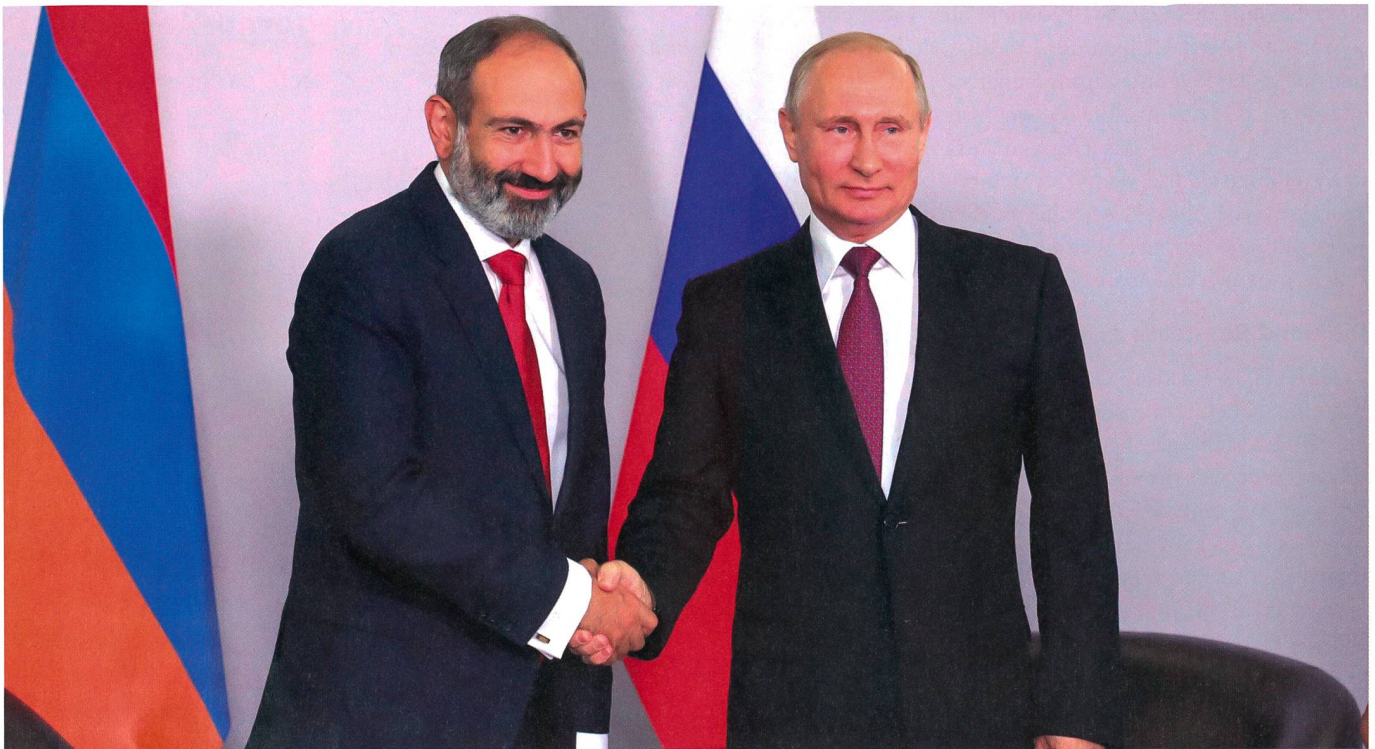
Der armenische Premierminister Nikol Paschinjan und Vladimir Putin.