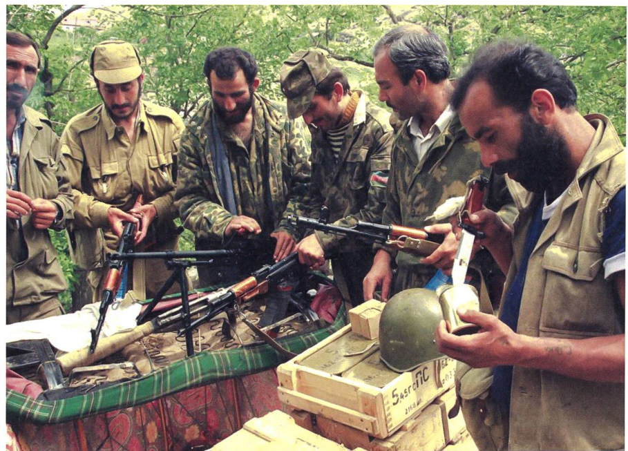
Aserbaidschanische Soldaten im Bergkarabach-Krieg 1992.

Dieser habe Europa mit glimmenden Konflikten umgeben, von Syrien, über Libyen, Zypern und Griechenland bis zu-