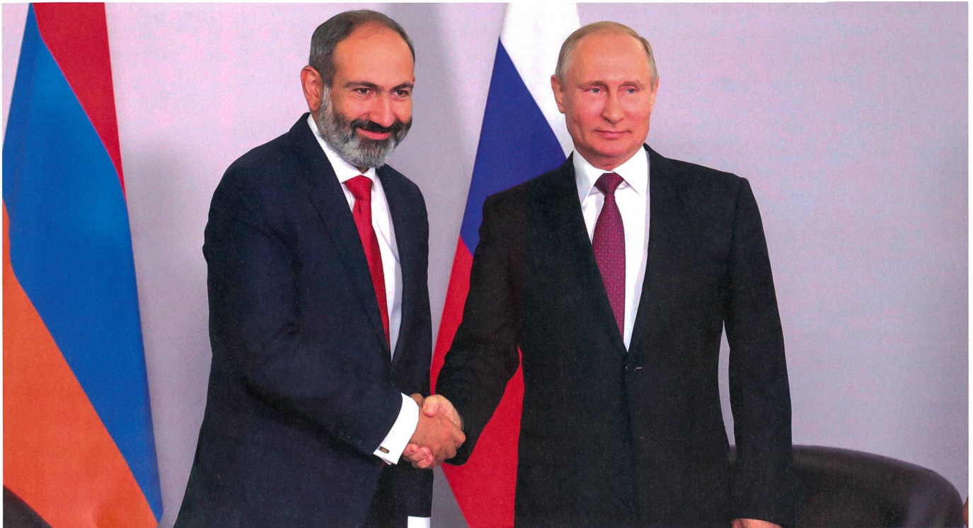
Der armenische Premierminister Nikol Paschinjan und Vladimir Putin.