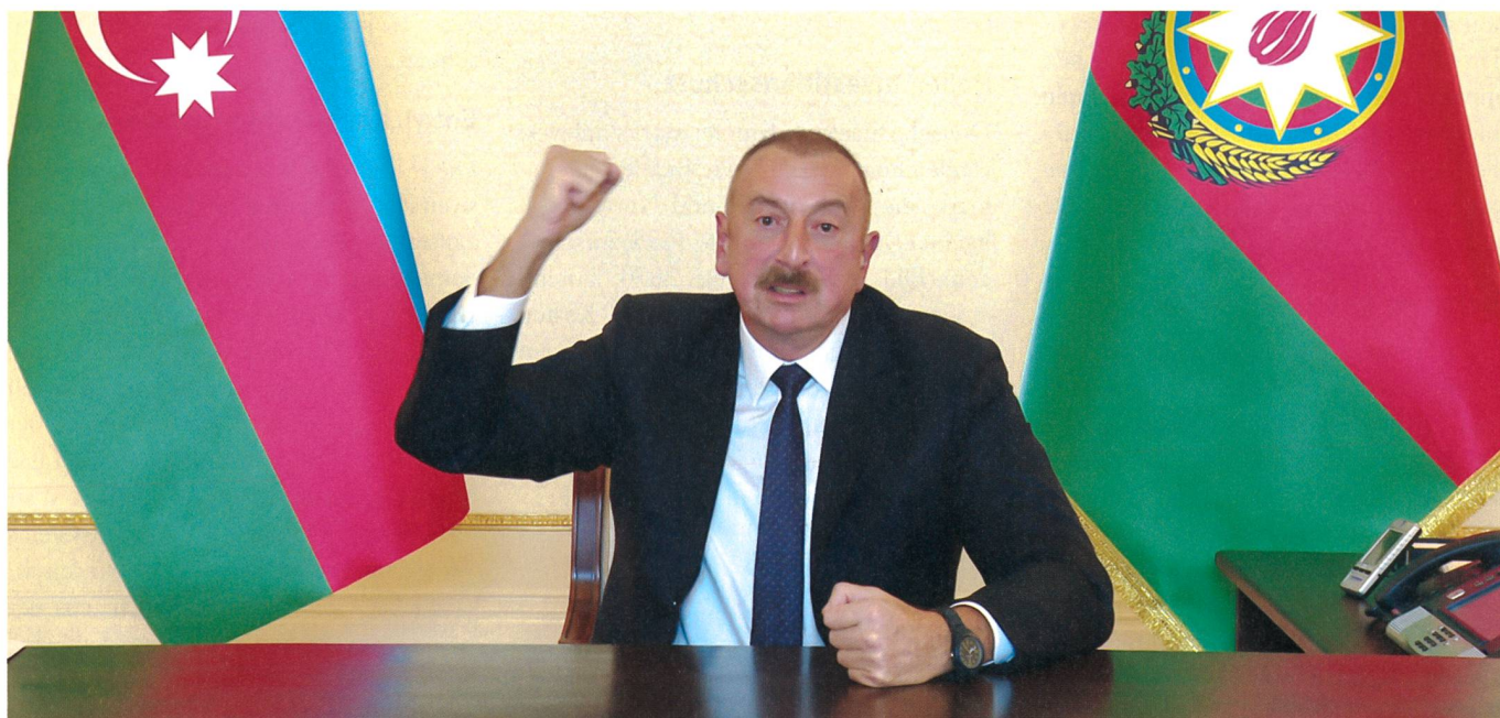
Ilham Aliyev Präsident von Aserbaidshan in einer Ansprache an sein Volk am 4.10.2020.

Das Feuer des Bergkarabach-Konflikts zwischen Armenien und Aserbaidshan schwelt seit dem Ende des Krieges 1994 und wurde Ende September 2020 neu entzündet. Die militärische Potenz Aserbaidshans, verbunden durch die massive Unterstützung durch die Türkei, macht eine friedliche Zukunft mittelfristig unrealistisch. Dieser Konflikt wird prognostisch noch viele Jahre andauern und zahlreiche weitere Menschenleben kosten, von Soldaten und von Zivilisten. +