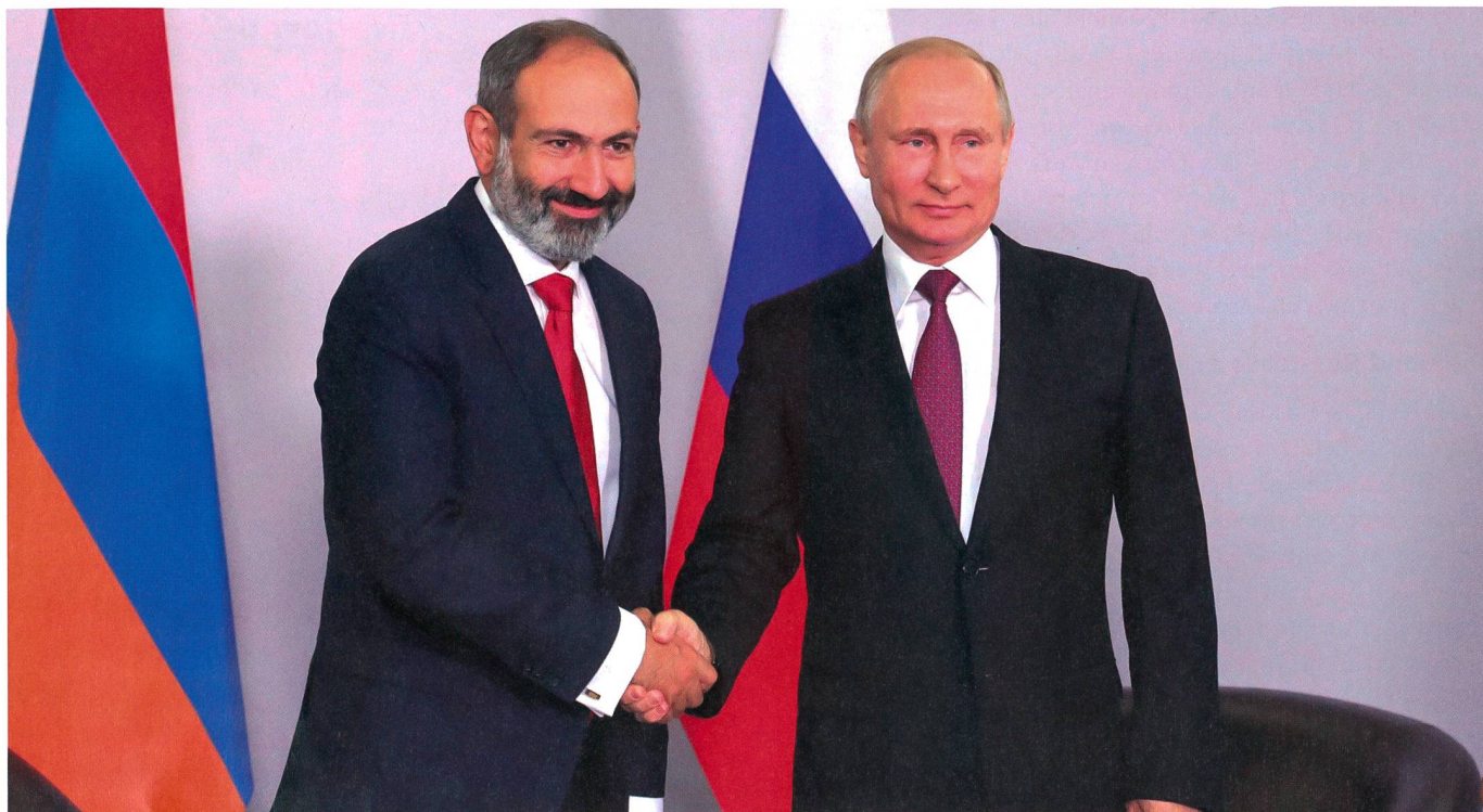
Der armenische Premierminister Nikol Paschinjan und Vladimir Putin.