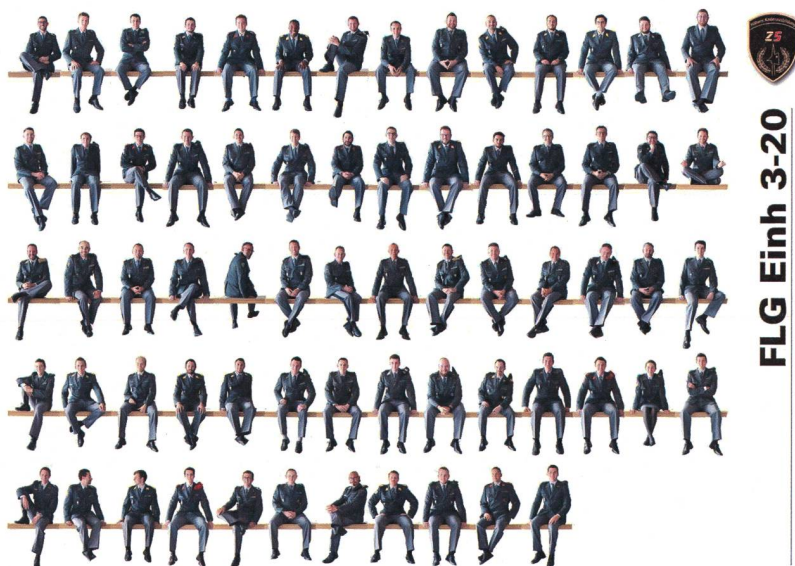
FLG Einh 3-20