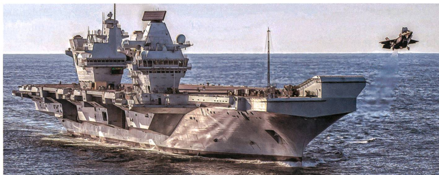
Start einer F-35B von der HMS Queen Elizabeth.

stärken. Laut einer Pressemeldung von Dassault will Griechenland 18 Rafale Kampfflugzeuge beschaffen. Die griechische Luftwaffe ist ein treuer Kunde bei dem französischen Flugzeugbauer Dassault. Bereits im Jahre 1974 hat das Land 40 Mirage F1 gekauft, Mitte der 1980er Jahre folgte eine Bestellung für 40 Mirage 2000 und im Jahr 2000 kamen noch 15 Mirage 2000-5 dazu, diese letzte Bestellung beinhaltet auch die Hochrüstung von zehn Mirage 2000 auf den modernen Mirage 2000-5 Standard. Griechische Zeitungen schreiben, dass die Regierung dahingehend informierte, dass der Auftrag sechs neue Maschinen und zwölf Gebrauchtflugzeuge umfassen soll.