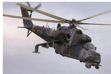
Verbesserter Kampfhelikopter Mil Mi-35P.

Russian Helicopters hat laut eigenen Angaben die Serienproduktion des verbesserten Mi-35P Kampfhelikopters begonnen. Die Mi-35P ist die Exportvariante des Mi-24 «Hind». Der leistungsgesteigerte Mi-35P Kampfhelikopter ist mit einem Beobachtungs- und Zielführungssystem OPS-24N-1L mit Wärmebildsensor, einer Videokamera für Farbbilder und einem neuen Laser-Entfernungsmesser ausgerüstet. Die Piloten können nun auch mit modernsten Nachtsichtbrillen der dritten Generation operieren. Der Mi-35P wurde mit einem modernen digitalen Flugsteuerungssystem ausgerüstet, welches die Piloten bei ihrer Arbeit entlasten soll. Der Waffeneinsatz wird durch ein modifiziertes Feuerleitsystem präziser. Bei dem Mi-35P handelt es sich um einen schweren Kampfhelikopter, der über eine enorme