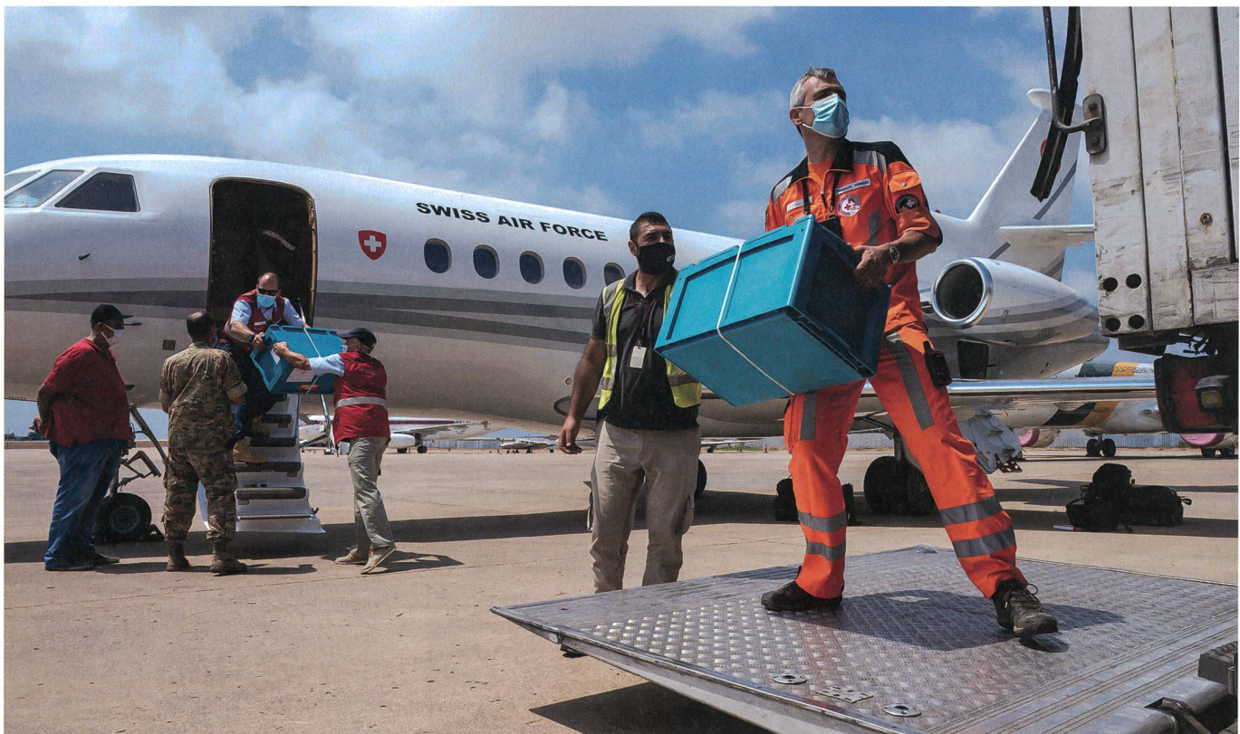
Hilfe kommt per Jet: Angehörige der humanitären Hilfe laden Material aus dem Regierungsjet.