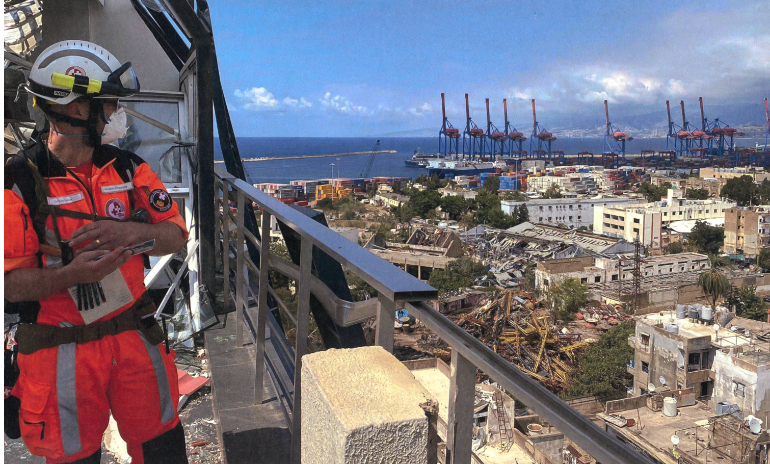
Hptm Privitera überblickt die Lage.