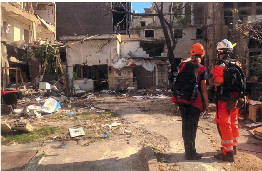
Die Schweizer wurden in drei Stadtteilen eingesetzt: Remeil, Qobayat und Karantina.

Privitera: Jugendliche, die mit Besen ausgerüstet ihre Stadt aufräumen. Der persönliche Kontakt mit der Bevölkerung und deren Dankbarkeit. Interessant waren auch die zahlreichen Gespräche mit den Leuten, welche über ihre Erlebnisse rund um die Explosion erzählt haben. Darunter war ein Vater von drei Kindern, welcher am Rücken durch Splitter verletzt wurde, weil er sich während der Explosion schützend über seine Kinder geworfen hatte.