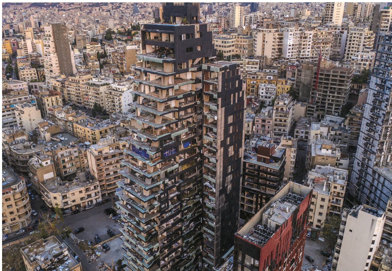
Ein Zerstörungsbild wie aus einer Kriegszone.

Insbesondere möchte ich mich bei Stabsadj Alec Rouiller und Oberstlt Thomas Zeiter für die Unterstützung, die Ausbildung und die Begleitung, die zurück geht bis zur Rttg OS im 2010, herzlich bedanken. ✚