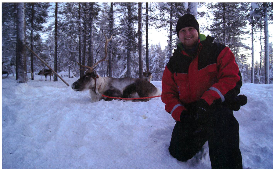
In meiner Lieblingsdestination «Finnland» (Hyvää päivää).