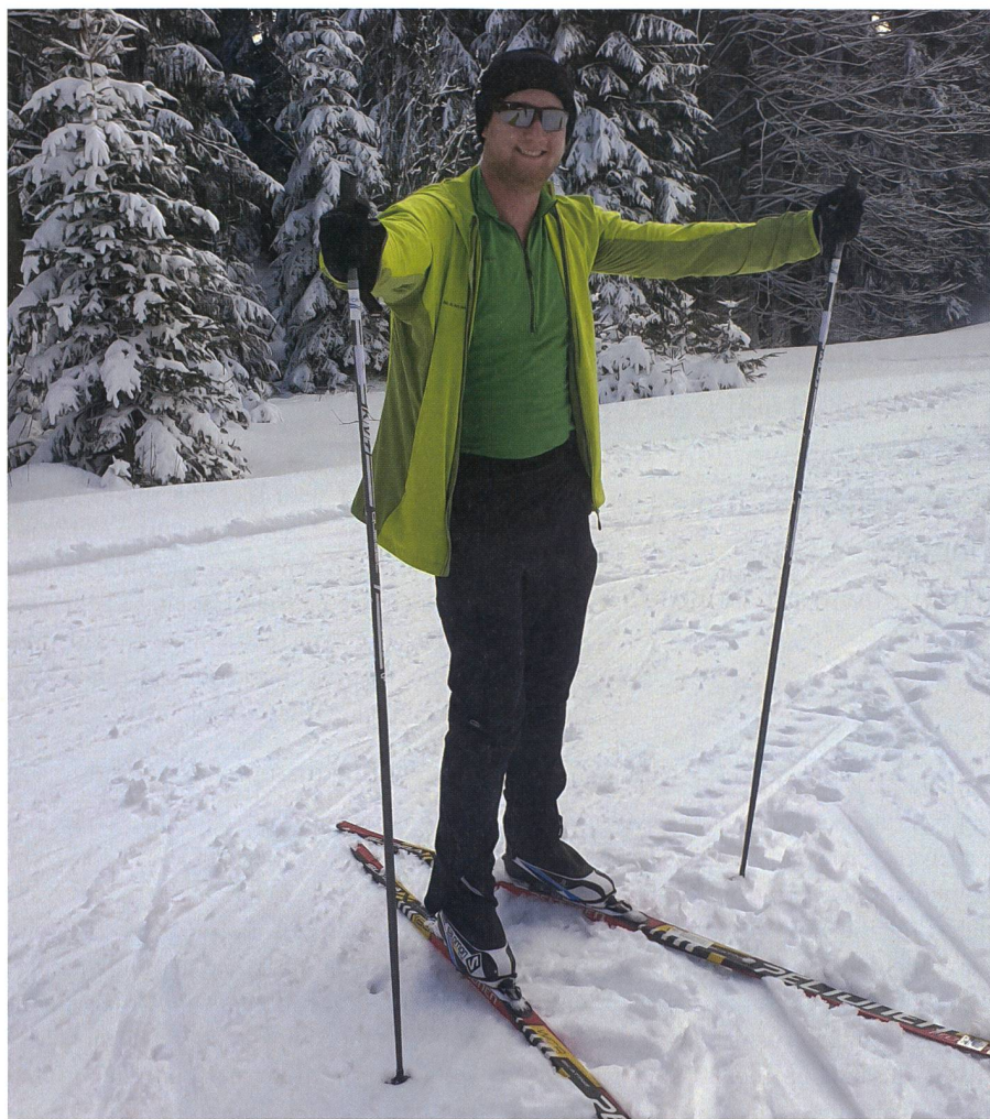
An der BUSA: Langlaufen während der Sprach- und Sportintensivwoche.

che Übernachtungsmöglichkeiten im Gebirge möglich sind. Dazu gehören Iglus, Schneehütten oder auch Biwaks. Natürlich durfte anschliessend die erste Nacht im selbstgebauten Schneebiwak nicht fehlen. Auch wenn es eine kalte Nacht war, hatten wir es in unserem Biwak gemütlich warm.