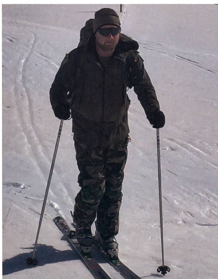
Bei der Skitour auf dem Gotthardpass.

Am Dienstag stand dann die grosse Tour auf dem Programm. Von Hospental verschoben wir mit unseren Tourenskiern auf den Gotthardpass. Als alle oben ankamen, zeigten uns die Gebirgsspezialisten, wel-