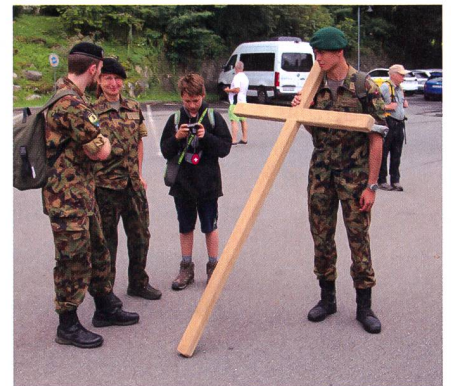
Kurzer Marschhalt von Sachseln nach Flüeli.

All dies begann mit dem Entschluss des Vorstands der Vereinigung PMI (Pérégrination militaire internationale Suisse) internationale Militärwallfahrt Schweiz, die coronabedingte Verschiebung der Wallfahrt nach Lourdes auf 2021 nicht ohne Reaktion zu lassen. Innert kürzester Zeit wurde das Projekt nationale Militärwallfahrt Schweiz geplant, bei den zuständigen Stellen der Armee als ausserdienstlicher Anlass und der Einsatz eines