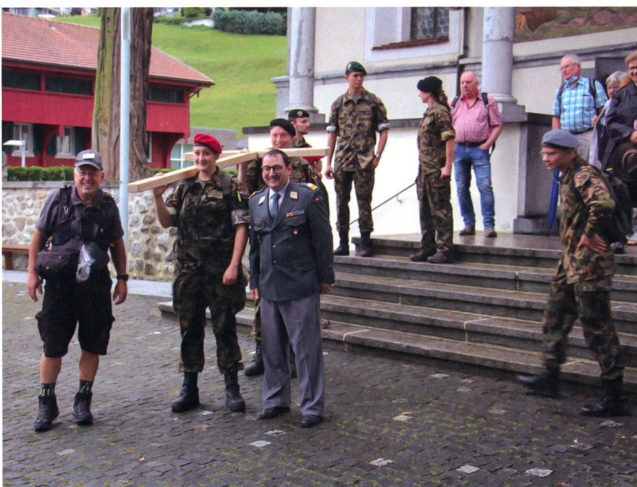
Aufbruchstimmung mit dem neuen Kreuz von Sachseln nach Flüeli.

Nach der Messe galt es den Weg nach oben zum Pilgerzentrum wieder unter die Füsse zu nehmen. Bei kameradschaftli-