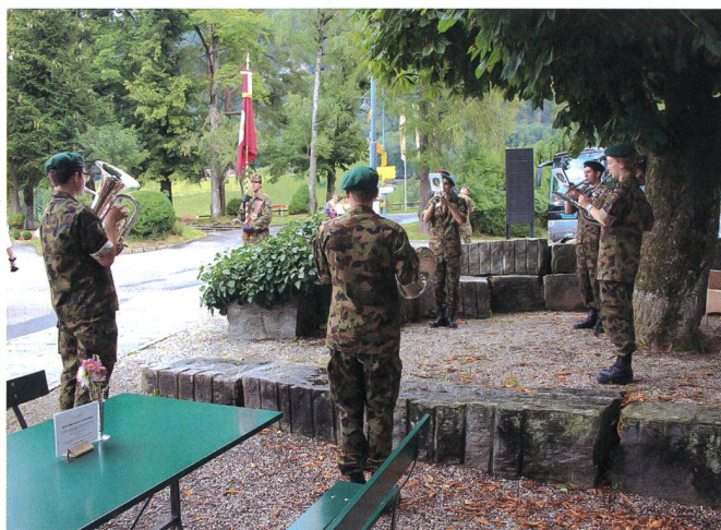
Ein seltener Anblick in diesem Jahr: Das Det des RS Spiels 16-2/2020 musiziert in Flüeli.