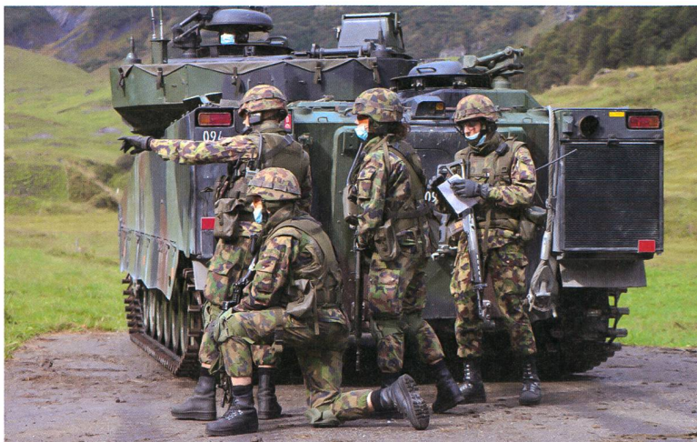
Der Gruppenführer bei der Befehlsausgabe.

offenhalten kann. Dabei müssen die Soldaten sowohl gepanzerte Gegner wie auch gegnerische Infanterie bekämpfen. Die Truppe wird dabei so nahe wie möglich mit dem Schützenpanzer transportiert und dringt dann abgesessen in die gegnerische Stellung ein.