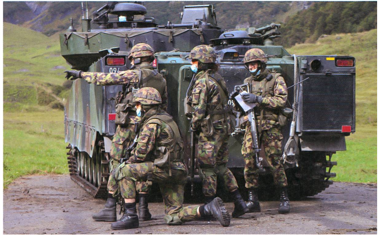
Der Gruppenführer bei der Befehlsausgabe.

offenhalten kann. Dabei müssen die Soldaten sowohl gepanzerte Gegner wie auch gegnerische Infanterie bekämpfen. Die Truppe wird dabei so nahe wie möglich mit dem Schützenpanzer transportiert und dringt dann abgesessen in die gegnerische Stellung ein.