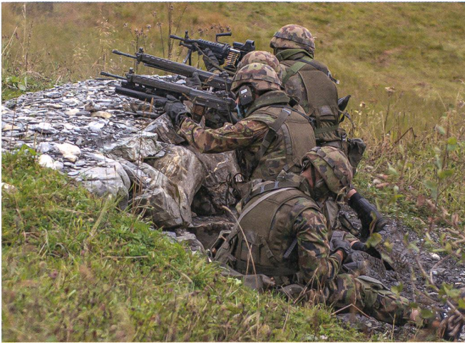
Panzergrenadiere im Gefecht.