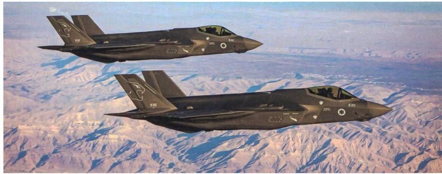
Zweites israelisches F-35-Geschwader einsatzbereit.

Nach sechs Monaten Vorbereitung hat die israelische Luftwaffe das zweite mit F-35I ausgerüstete Geschwader für einsatzbereit erklärt. Die «Löwen des Südens», so der Name des 116. Einsatzgeschwaders, starten mit dem Stealth Fighter ab sofort in den operativen Alltag. Als zweites Einsatzgeschwader in Israel machten sie sich mit dem neuen Stealth Fighter aus den USA vertraut, der in Israel «Adir» genannt wird: der Mächtige. Mächtig waren auch die