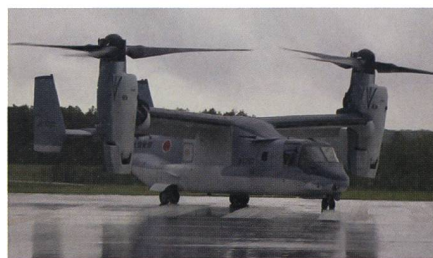
Japan als erster Exportkunde der V-22 Osprey.

Boeing hat am 10. Juli 2020 das erste Kipp rotorflugzeug vom Typ Bell Boeing V-22 Osprey an Japan übergeben, Japan wird damit nach den USA zu dem zweiten Osprey Betreiber. Die erste V-22 Osprey wurde per Schiff aus den USA auf die Ma-