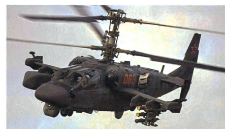
Erfolgreicher Erstflug der Ka-52M.