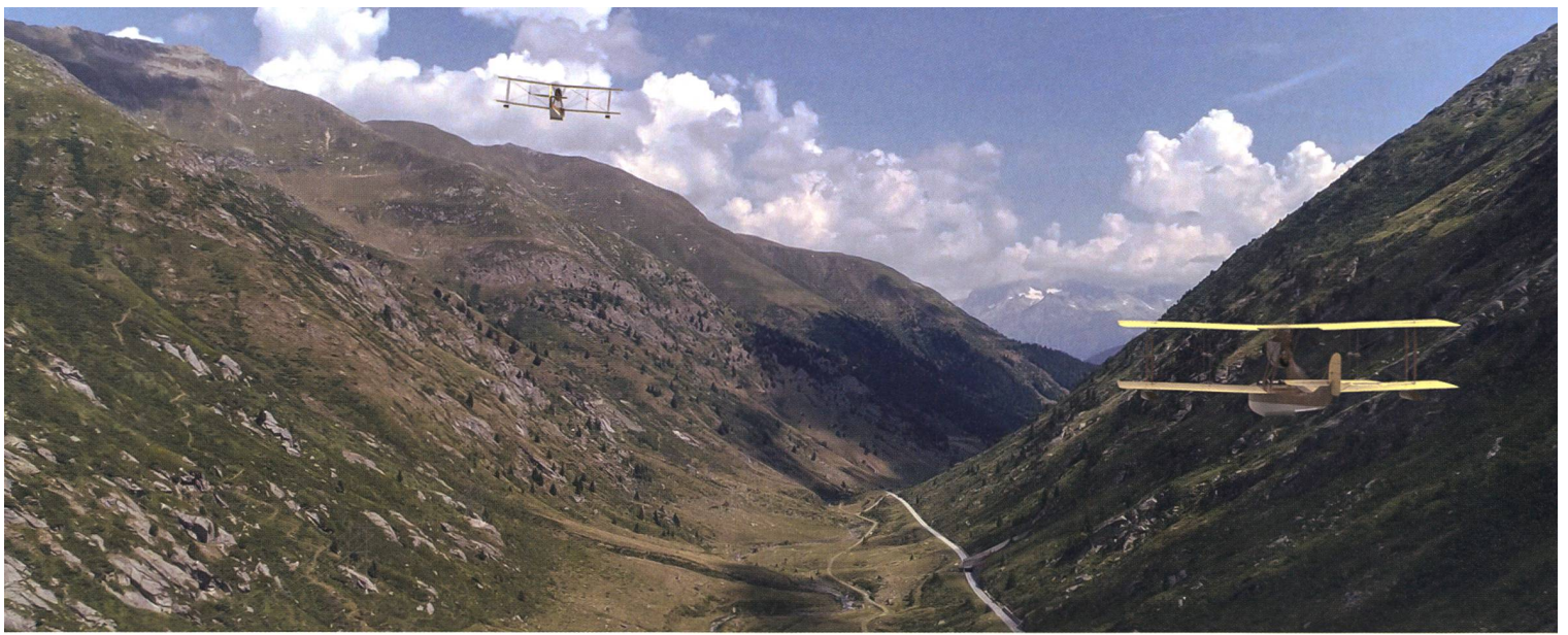
Nachgestellte Szene des Fluges über die Schweiz.