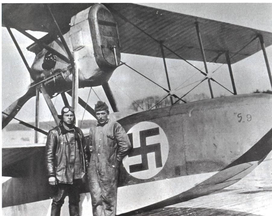
Pilot und Bordmechaniker vor einer Savoia mit finnischem Hoheitszeichen.