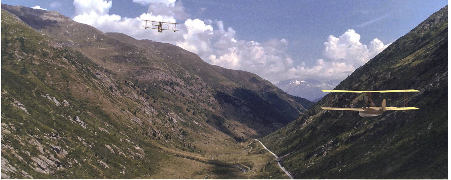
Nachgestellte Szene des Fluges über die Schweiz.