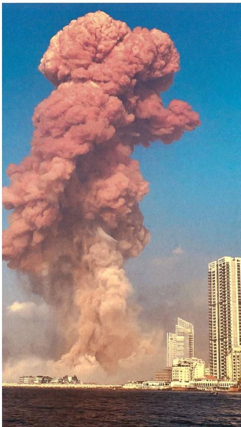
Die schwere Explosion im Hafen von Beirut.

Die Hisbollah (Arabisch «Hizb Allah», Partei Gottes) ist eine libanesisch-schiiti-