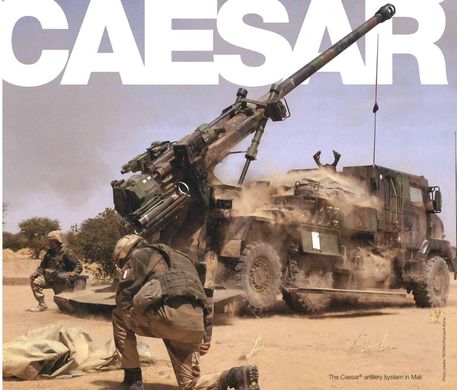
The Caesar® artillery system in Mali