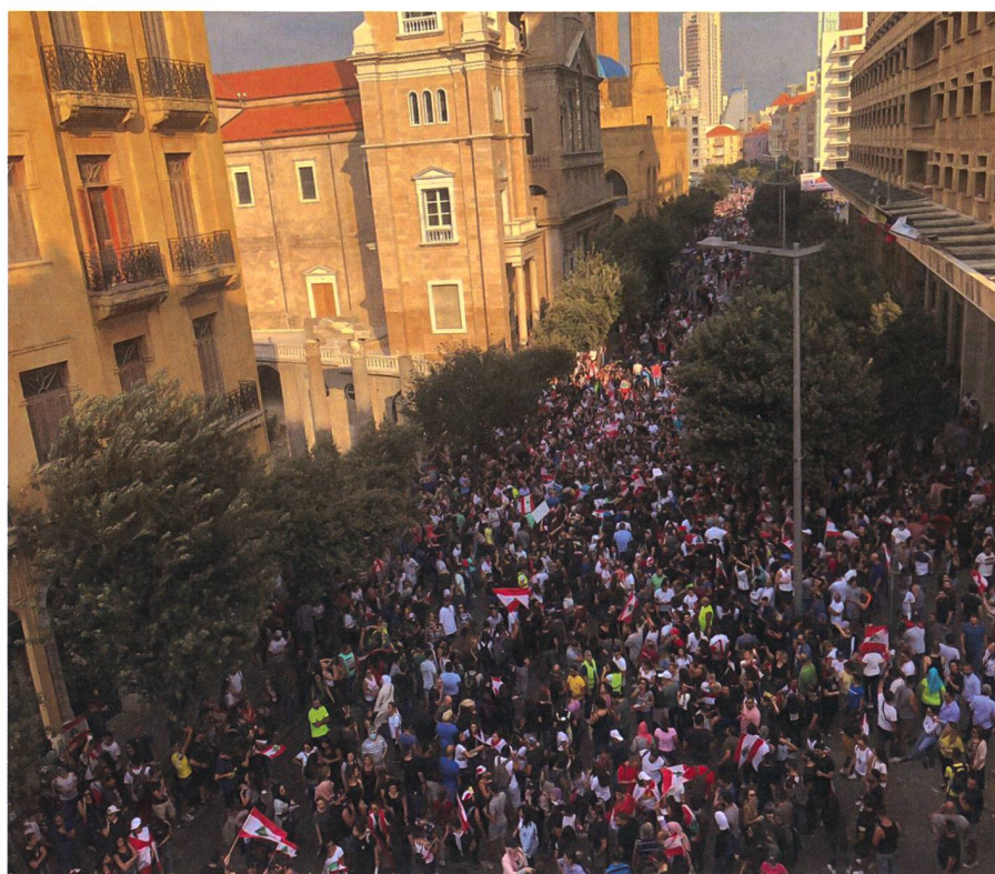
Hunderttausende Demonstranten versammelten sich im Herbst 2019 in Beirut zu Protesten gegen die Korruption der politischen Führung.

Nach einem Anschlag in Bulgarien im Jahr 2013, dem sechs Menschen zum Opfer fielen, hat die Europäische Union den sogenannten «militärischen Flügel» der Hisbollah als terroristische Organisation eingestuft, sich jedoch dafür ausgespro-