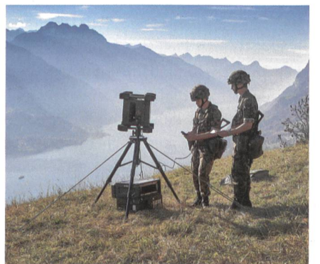
Silbergrau: Übermittlungs- und Führungsunterstützungstruppen