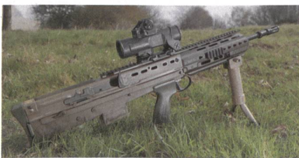
Kampfwertsteigerung des britischen Sturmgewehrs SA80 durch H&K.

Heckler&Koch hat einen Grossauftrag aus Grossbritannien erhalten und modernisiert im Rahmen des Equip to Fight-Programms der britischen Armee das Standardgewehr SA80 zur Version SA80A3. Die Modernisierung umfasst unter anderem einen neuen Sturmgriff, ein verbessertes Gehäuseoberteil, zusätzliche Sicherheitsfunktionen sowie Massnahmen zur Gewichtsreduzierung des Sturmgewehrs. Hierfür legt der nun geschlossene Drei-Jahres-Vertrag mit einem Gesamtvolumen von über 15 Mio. Brit.