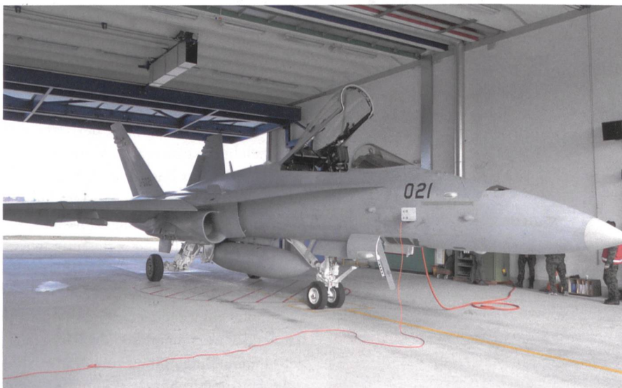
Werden kontrolliert F/A-18 C/D.