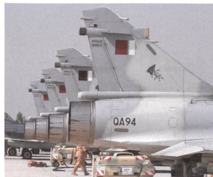
Katar setzt 1 Staffel Mirage 2000-5 ein.