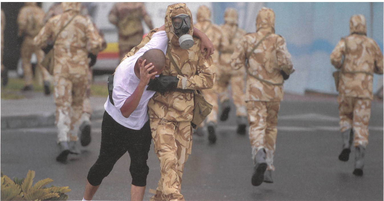
Soldaten des katarischen Mechanisierten Infanteriebataillons trainieren den Anti-Terror-Kampf im ABC-Schutzanzug.

Doha stellte die diplomatischen Beziehungen zu Teheran wieder her. Saudi-Arabien hatte damit genau das Gegenteil seiner Intention erreicht. Es trieb regelrecht den aufmüpfigen Nachbar in die Arme des schiitischen Erzfeindes.