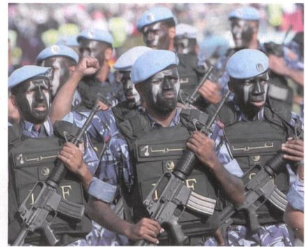
Katar hat eine Einheit Sondertruppen.