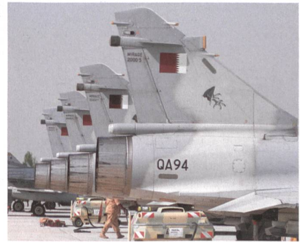
Katar setzt 1 Staffel Mirage 2000-5 ein.