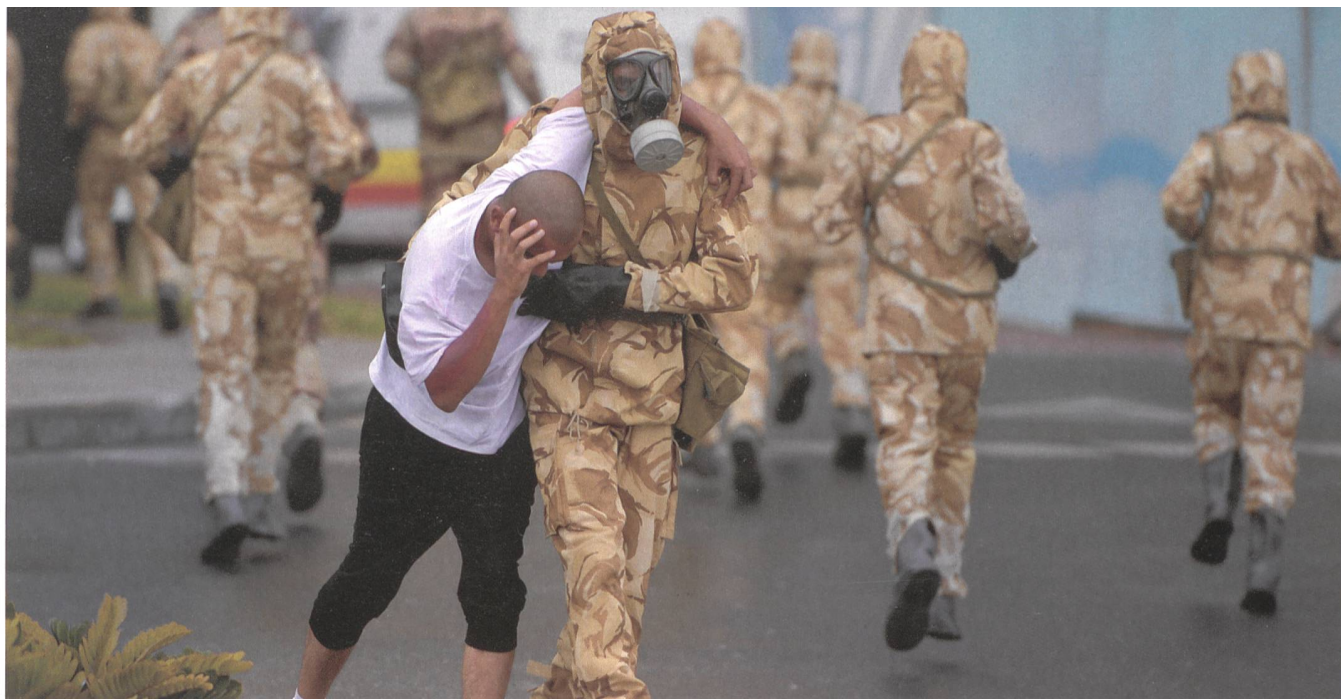
Soldaten des katarischen Mechanisierten Infanteriebataillons trainieren den Anti-Terror-Kampf im ABC-Schutzanzug.

Doha stellte die diplomatischen Beziehungen zu Teheran wieder her. Saudi-Arabien hatte damit genau das Gegenteil seiner Intention erreicht. Es trieb regelrecht den aufmüpfigen Nachbar in die Arme des schiitischen Erzfeindes.