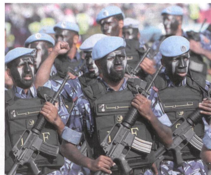
Katar hat eine Einheit Sondertruppen.