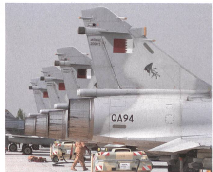
Katar setzt 1 Staffel Mirage 2000-5 ein.