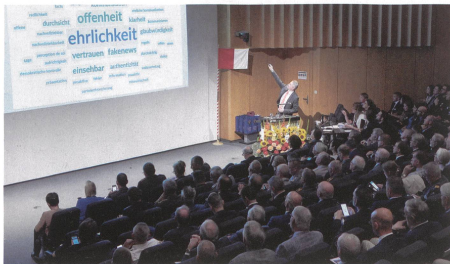
Gut besucht: Herbsttagung 2019.

Der Armee bieten sich Chancen die Jugendliche über diese Kanäle zu erreichen und im Gespräch zu bleiben. Am Ende der Herbsttagung war klar: Wenn jemand Chancen nutzt, dann die MILAK! Die Organisatoren haben erneut ein gutes Gespür bewiesen und eine spannende Vortragsreihe mit Diskussionsrunde organisiert.