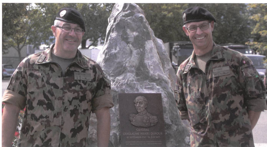
Gut gelaunte Verpflegungs-Klassenlehrer.