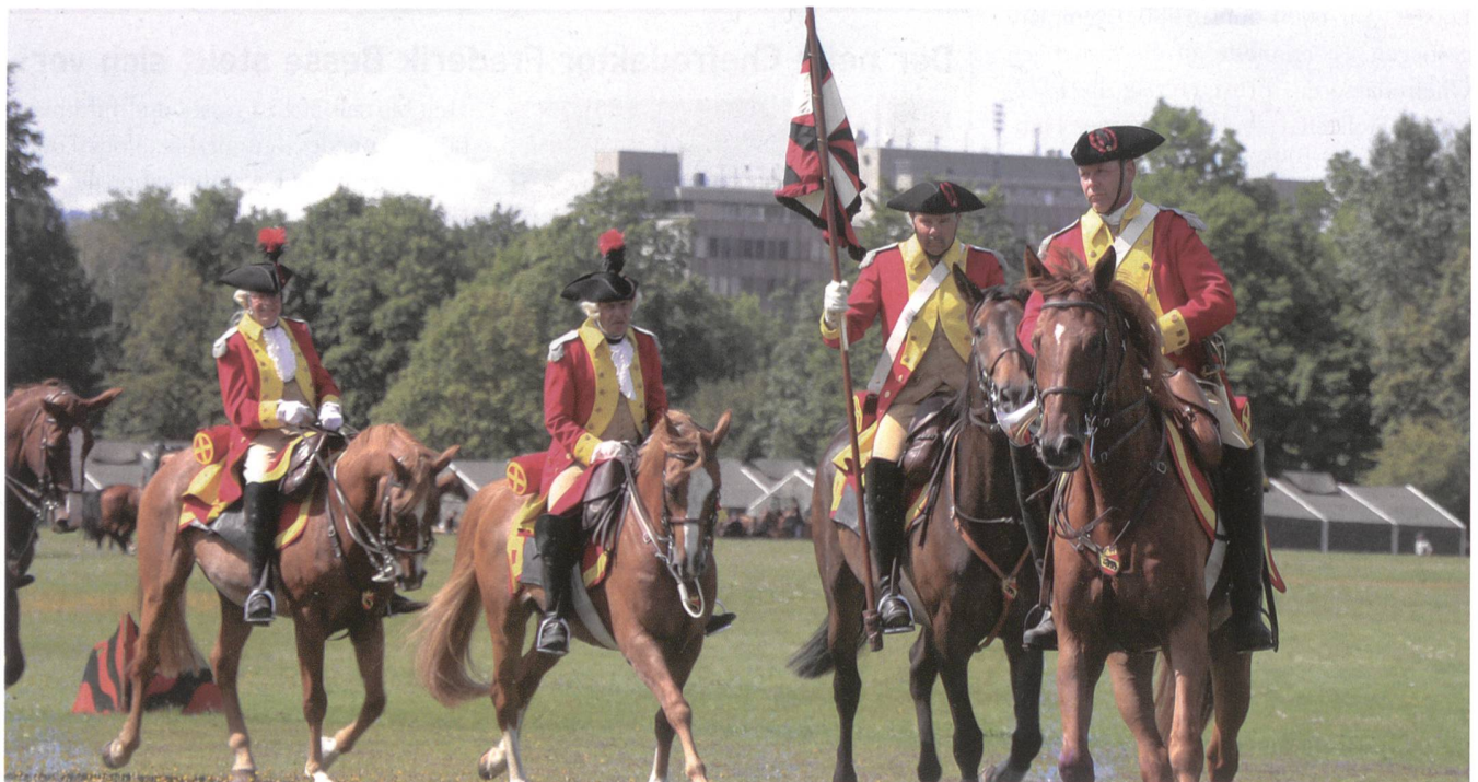
Im Galopp: Historische Reiter.

Im Rahmen des Anlasses führten verschiedene Rekrutenschulen ebenfalls ihren Besuchstag auf dem Thuner Festgelände durch. Männer und Frauen der Artillerieschule, der Panzerschule sowie den Rekrutenschulen der Instandhaltung, der ABC Abwehr sowie der Elektronischen Kriegsführung (EKF) zeigten ihre Ausrüstung und Können. Ein Spass für Freunde und Familie sowie für Kameraden aus den anderen Waffengattungen. So entstanden einzigartige Szenen, wie jene in der eine Infante-