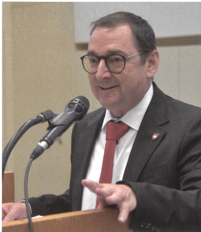
«Gutes muss gesagt sein»: Der neue Präsident hat das Wort.

nanzen immer im Griff gehabt habe. «Ich danke ganz herzlich für sein unermüdliches arbeiten für die Zeitschrift, für die Armee und das Land.»