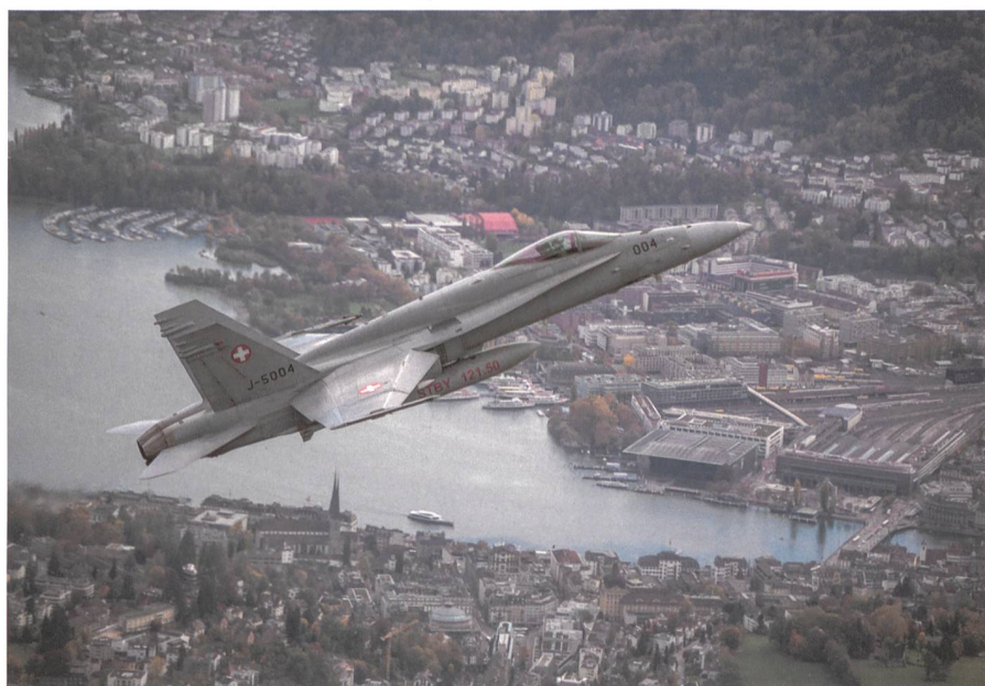
Die Luftwaffe muss dringend erneuert werden.