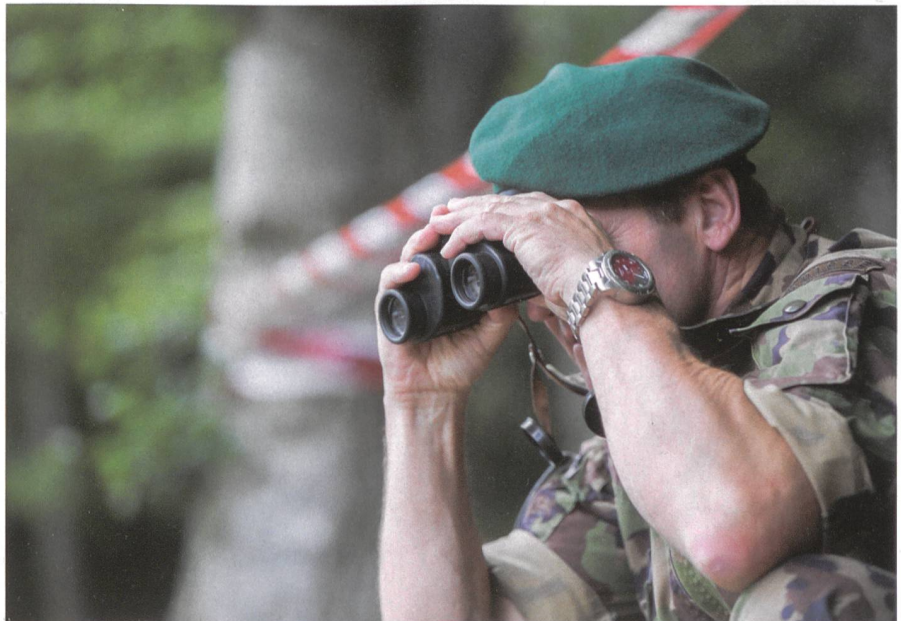
Sicherheitspolitik muss nachhaltig gestaltet werden.