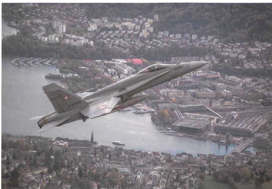
Die Luftwaffe muss dringend erneuert werden.