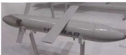
Neue Luft-Boden-Waffe HUSSAR.

Basierend auf aktuellen Einsatzerfahrungen soll das besonders leichte Waffensystem mit der Bezeichnung HUSSAR die Vorteile einer höheren Waffenbeladung mit der Möglichkeit einer präzisen Wirkung gegen zeitkritische Ziele verbinden. Die skalierbare Wirkung des Gefechtskopfs ist für die Bekämpfung von stationären