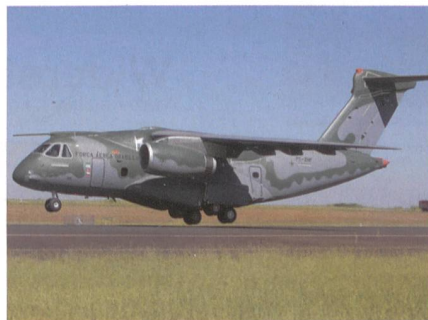
Transportflugzeug KC-390 für Portugal.

Die portugiesische Regierung hat einen Auftrag über fünf Embraer KC-390 Militärtransporter erteilt. Sie sollen die C-130H Hercules ablösen. Angesichts der Verzögerungen werden die ersten Lieferungen an die portugiesischen Luftstreitkräfte nun 2023 erwartet. Die zweistrahligen Transporter gehen an die Esquadra 501 in Montijo. Dort wird auch ein Flugsimulator installiert. Zur Beschaffung gehört