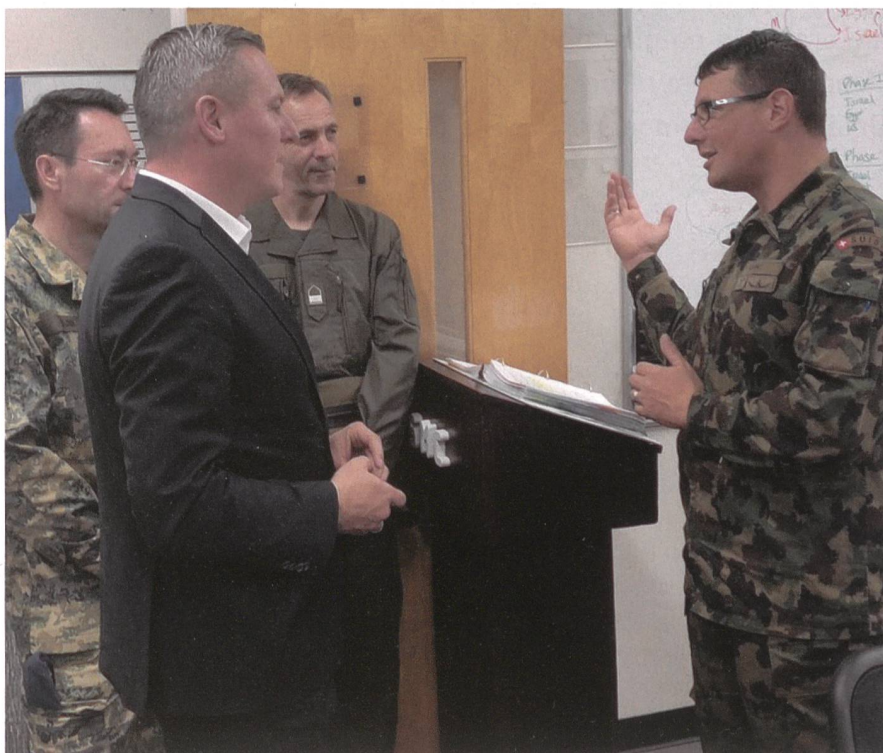
Der ex-Verteidigungsminister von Österreich, Mario Kunasek, zu Gast.