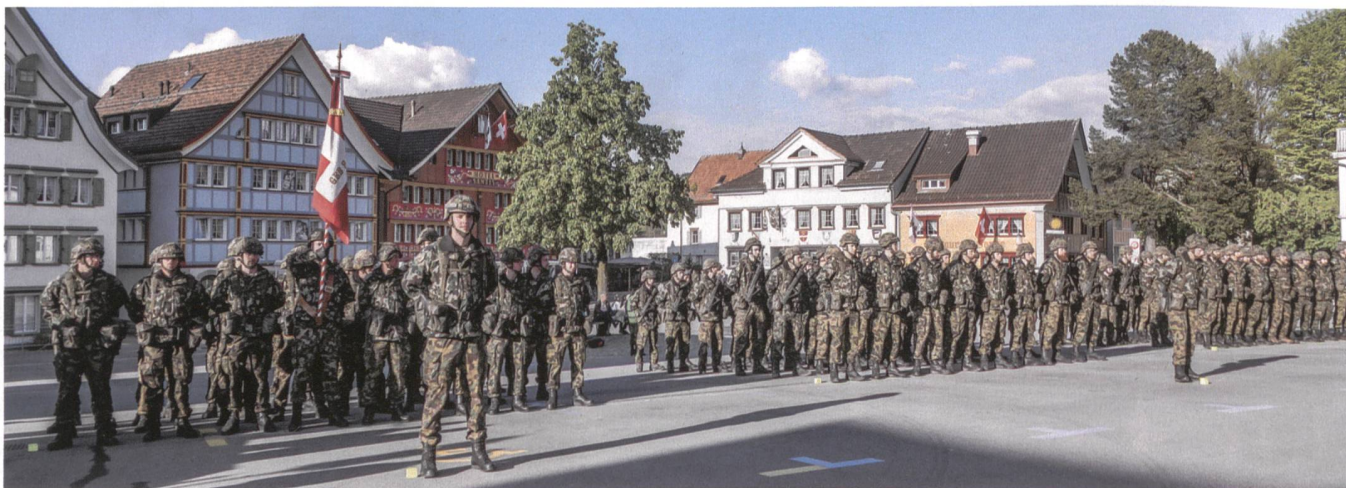
Das Geb S Bat bei der würdigen Fahnenzeremonie.