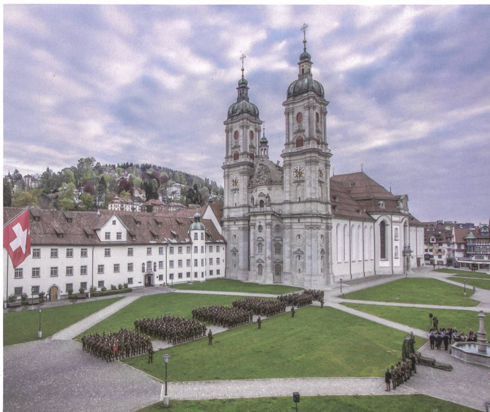
Im Klosterhof von St. Gallen.

Kp Kdt 6/4 Hptm Fabian Wippel, Sachbearbeiter Komp Zen SWISSINT