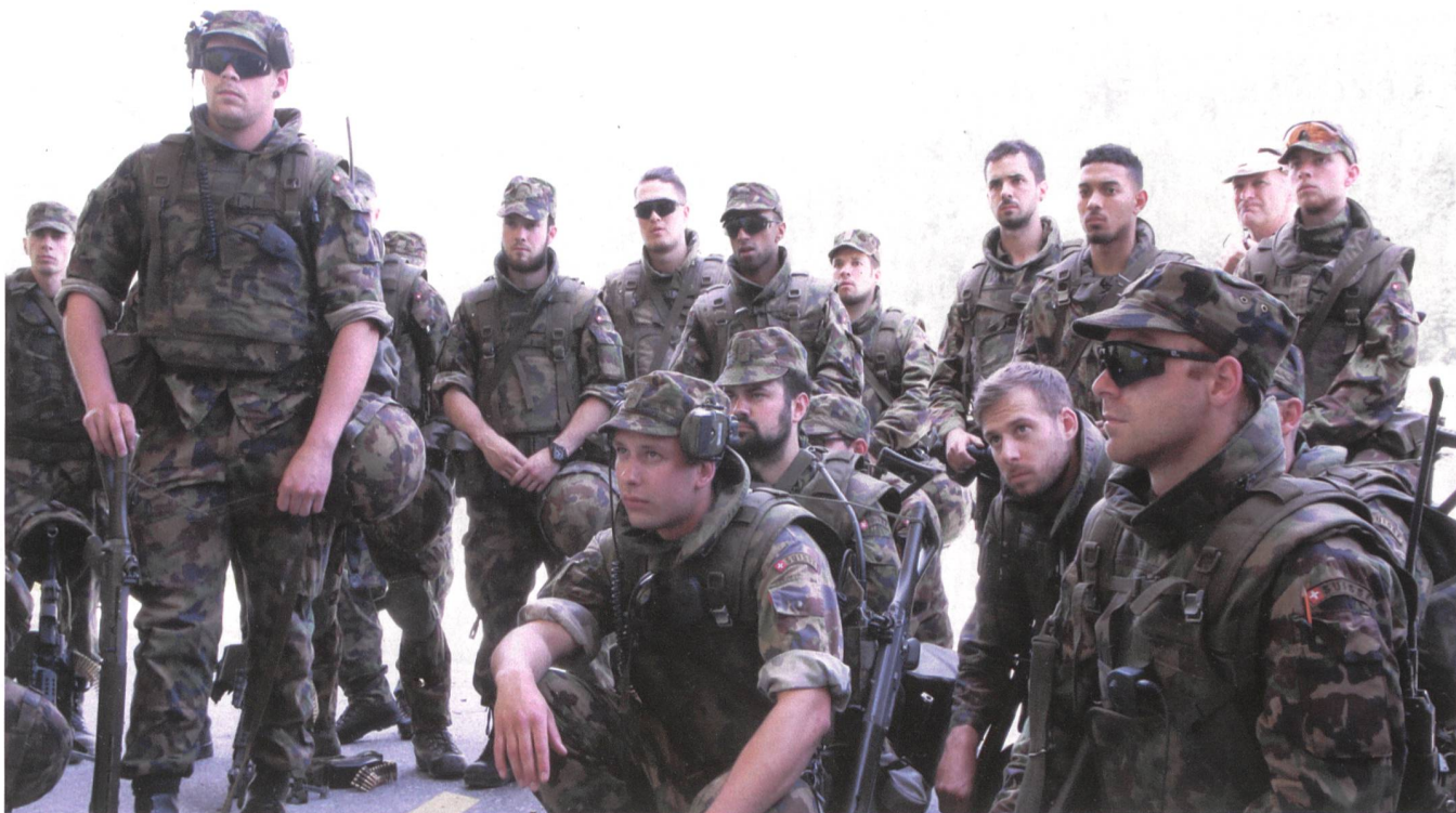
Auf dem Gefechtsschiessplatz Wichlen/GL: Die Infanteriekompanie 61/1 an der Befehlsausgabe vor dem Gefechtsschiessen.