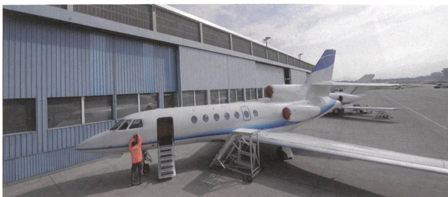
Der Standort Genf-Cointrin.