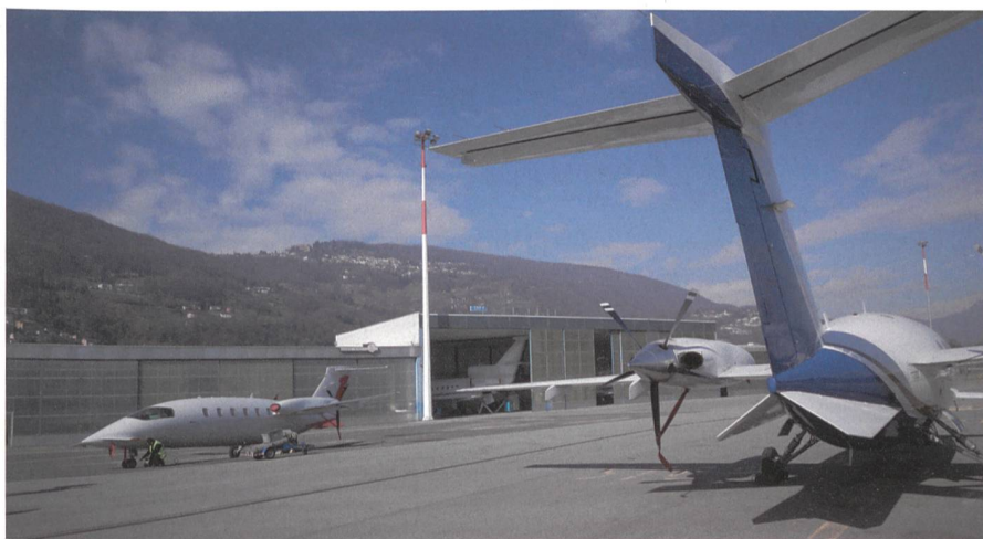
Der Standort Lugano-Agno.

RUAG verkauft als Folge der neuen strategischen Ausrichtung die beiden auf Business Jets spezialisierten Standorte an den Flughäfen Genf-Cointrin und Lugano-Agno. Käufer ist Dassault Aviation. Der neue Eigentümer übernimmt alle 87 Mitarbeiter. Der Verkauf der RUAG Business Aviation AG ist der erste Schritt bei der Neuausrichtung des Portfolios von RUAG.