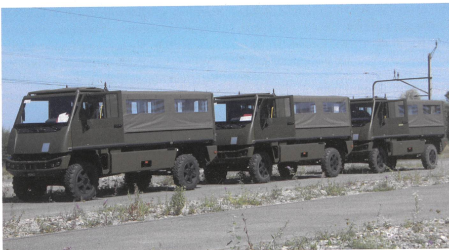
Ermatingen, 8. August 2019: Östlich der grossen Werkhalle, in der Mowag insgesamt 2220 Duro erneuert, stehen Duro zur Abfahrt bereit. Wie Armasuisse und Mowag mitteilen, wurde am 12. Juli 2019 als neuer Motor ein Turbo-Dieselaggregat von Fiat ausgewählt, das die strenge EURO-6-Abgasnorm erfüllt.

Medienmitteilung der Armasuisse vom 12. Juli 2019 zur Werterhaltung Duro, gekürzt