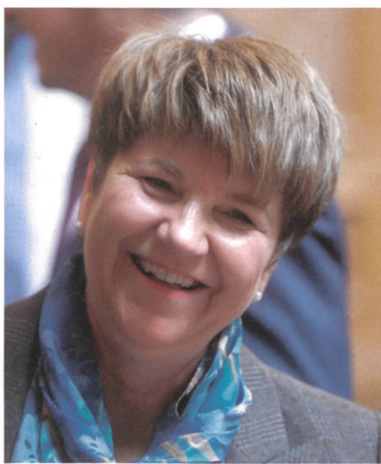
Viola Amherd: Die Armee muss auf die Veränderung der Bedrohung reagieren.

Gerade die Beschaffung von Kampfflugzeugen wird immer heftig diskutiert.