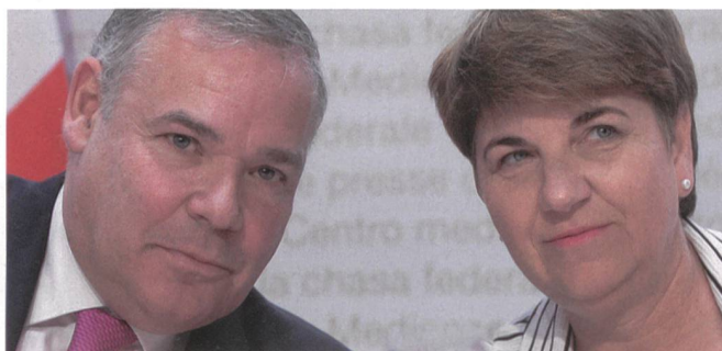
Gaudin mit der Chefin, Bundesrätin Amherd. Viola Amherd und Jean-Philippe Gaudin waren im Bundesrat erfolgreich.