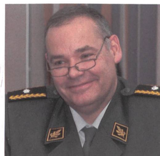
Im MND war Gaudin Brigadier, als VA in Paris Divisionär.